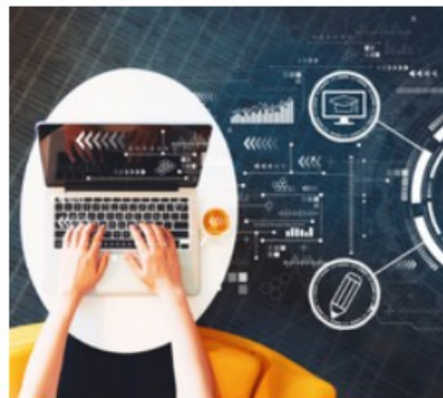
Edukacja i podnoszenie kompetencji na rynku pracy