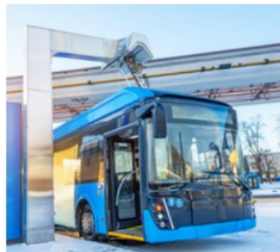
Transport i mobilność