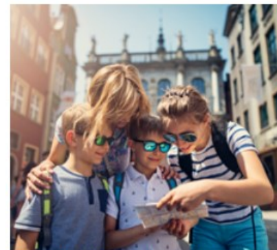
Kultura i turystyka