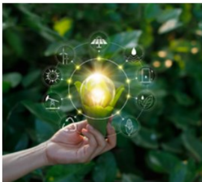
Dostosowanie do zmian klimatu