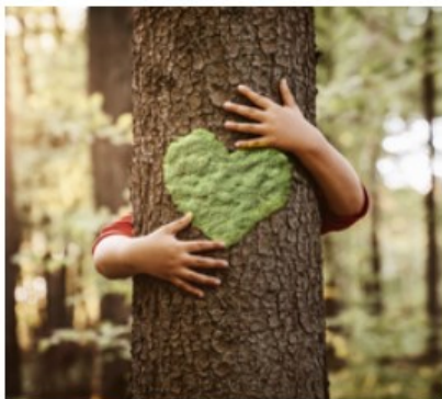
Zachowanie i ochrona środowiska