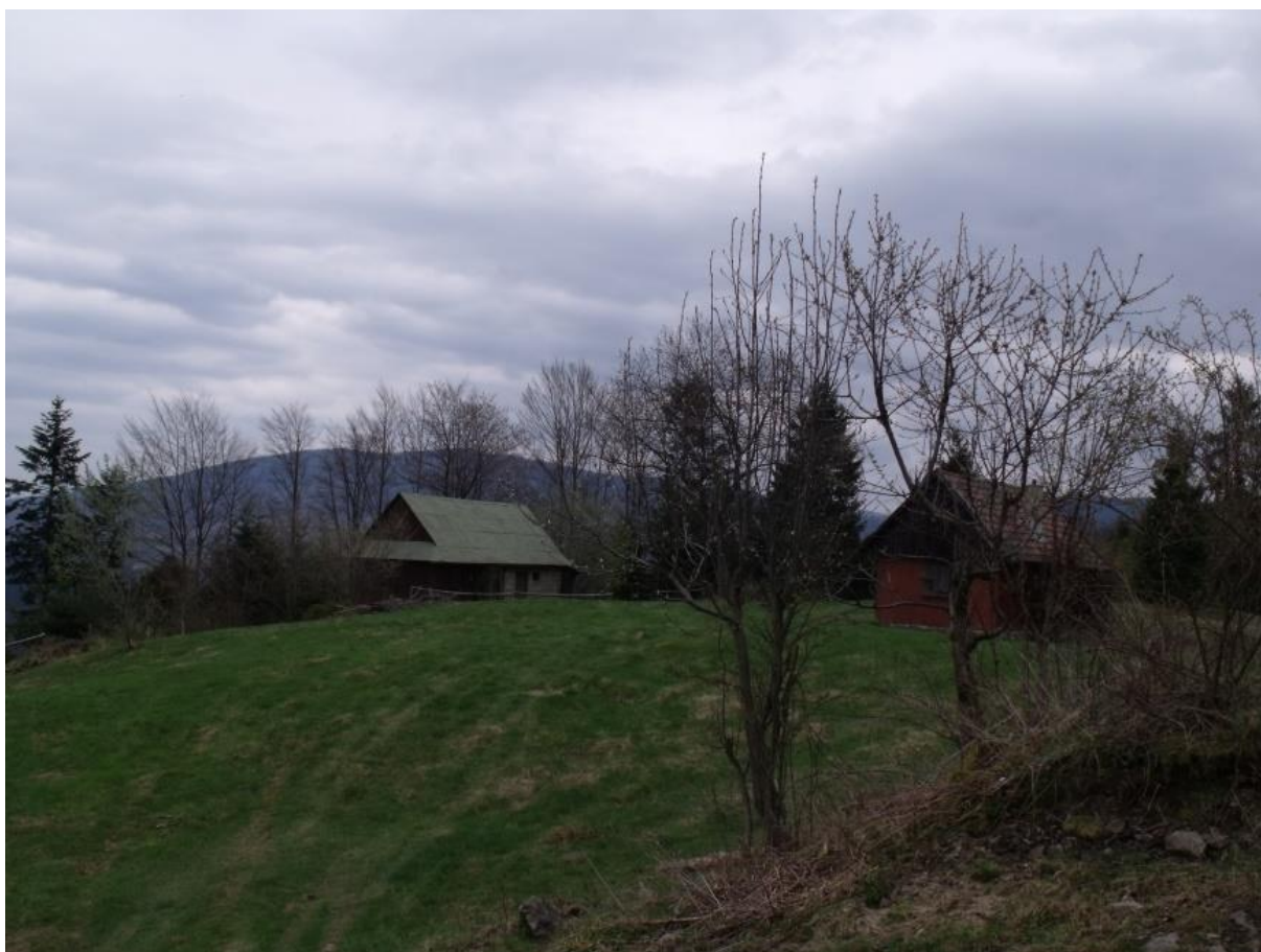
Fot. 44. Prusów

Okazały szczyt (1010 m n.p.m.) w zachodniej części Beskidu Żywieckiego tworzący poniekąd samodzielny masyw pomiędzy dolnym biegiem Żanicy (od północy), Milowskim Potokiem (od południa) i Sołą (od zachodu). Na jego stokach znajdują się rozległe polany z zabudowaniami przysiółków Milówki, Prusów i Juraszka. Spłaszczony wierzchołek Prusowa pokryty był w przeszłości polami uprawnymi, co na tej wysokości było rzadkością. Obecnie porzucone pola zarastają. O ich występowaniu świadczą charakterystyczne kopce kamienne sięgające nawet do wysokości 1,5 m porośnięte borówką. Po dawnych polach ornych pozostały też wyraźne miedze i bruzdy. Kamienie te zarośnięte są borówkami czarnymi, malinami i jeżynami, a szczeliny między kamieniami stanowią schronienie dla jaszczurek, węży, drobnych gryzoni, łasic. Niestety w 2015 r. zostały one zniszczone podczas prac ziemnych, co przyniosło zarówno straty przyrodnicze, jak i utratę wartości kulturowych, gdyż kamienne kopce były zapisem trudu gospodarowania w górach w przeszłości.