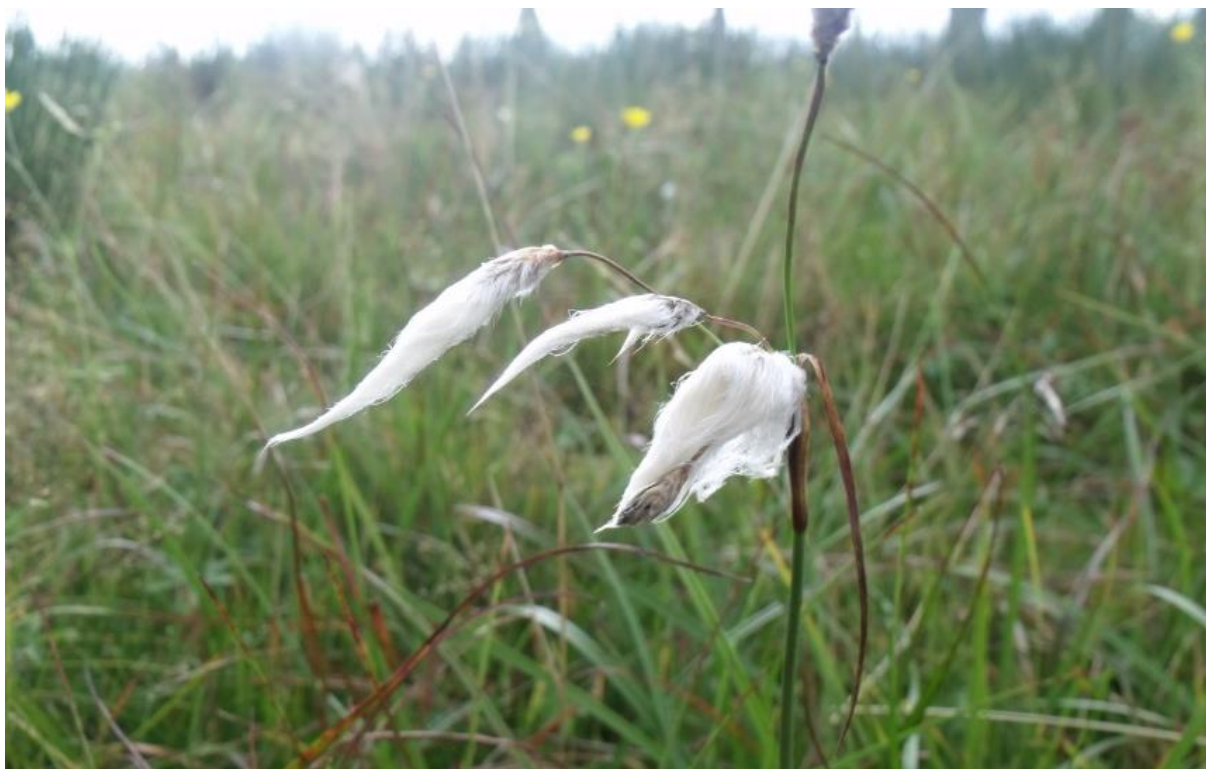
Fot. 60. Wełnianka

Stałe mokre miejsca na zboczach górskich, zasilane wodami podziemnymi, które wydostają się na powierzchnię w postaci wysięków tworzą młaki górskie. Wysiękające wody napotykając na utrudniony odpływ, powodują lokalne zabagnienia terenu. Młaki górskie rozwijają się dość licznie w Karpatach, szczególnie w piętrze regla dolnego. W Sudetach są znacznie rzadsze. Z reguły nie zajmują dużych powierzchni i najczęściej były lub nadal są użytkowane kośnie. Wprawdzie są to zbiorowiska występujące naturalnie, jednak w skutek działalności człowieka rozszerzyły swój zasięg występowania. Znaczenie miało tutaj odlesianie i związane z tym zwiększenie odpływu wód podziemnych.