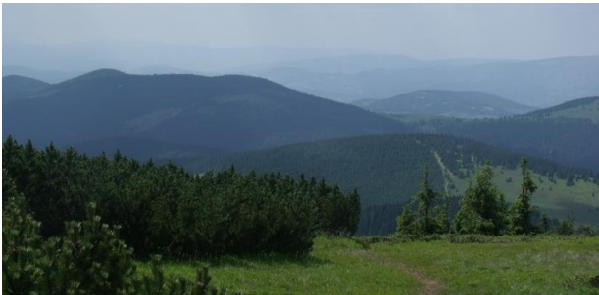
Fot. 78. Pilsko. Środowisko życia darniówki tatrzańskiej

Bezpośrednie jednak związki kultura pasterska wykazuje ze zwierzętami obszarów odlesionych. W obrębie Beskidu Śląskiego i Żywieckiego fauna obszarów nieleśnych związana jest z terenami rolniczymi położonymi poniżej lub w dolnej części pasa lasów reglowych oraz z górnoreglowymi halami i polanami. Ten drugi obszar ukształtowany pod wpływem osadnictwa wołoskiego miał duże znaczenie dla rozwoju wysokogórskich gatunków roślin i zwierząt. Wyrobione w lasach polany grzbietowe połączone ze szczytową partią Pilska (piętro kosodrzewiny) spowodowały wędrówkę wielu wysokogórskich gatunków i rozprzestrzenienie się ich na znacznie większym obszarze niż miało to miejsce przed przybyciem w te strony pasterzy wołoskich.