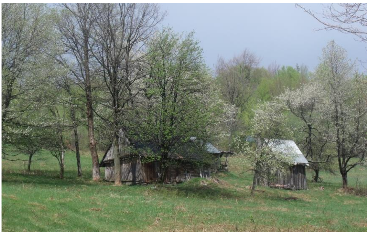
Fot. 14. Szopki w dolnej części Hali Ostre