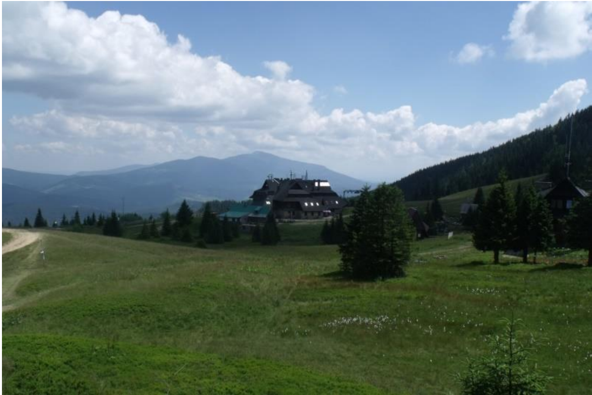
Fot. 73. Na Hali Miziowej

Występowanie: Europa, Azja, Ameryka Północna, w Europie głównie w górach, w Polsce jest to gatunek bardzo rzadki, posiada kilka stanowisk na niżu, a poza tym występuje w Tatrach, Beskidzie Żywieckim i Karkonoszach. Jej jedyne stanowiska w Beskidach zlokalizowane są na Hali Miziowej i Hali Cebulowej.