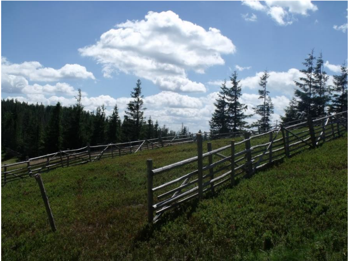
Fot. 62. Boróczyśko na Hali Radziechowskiej

W ostatnich latach prowadzi się jednak zabiegi z zakresu czynnej ochrony przyrody polegające na wycinaniu krzewów.