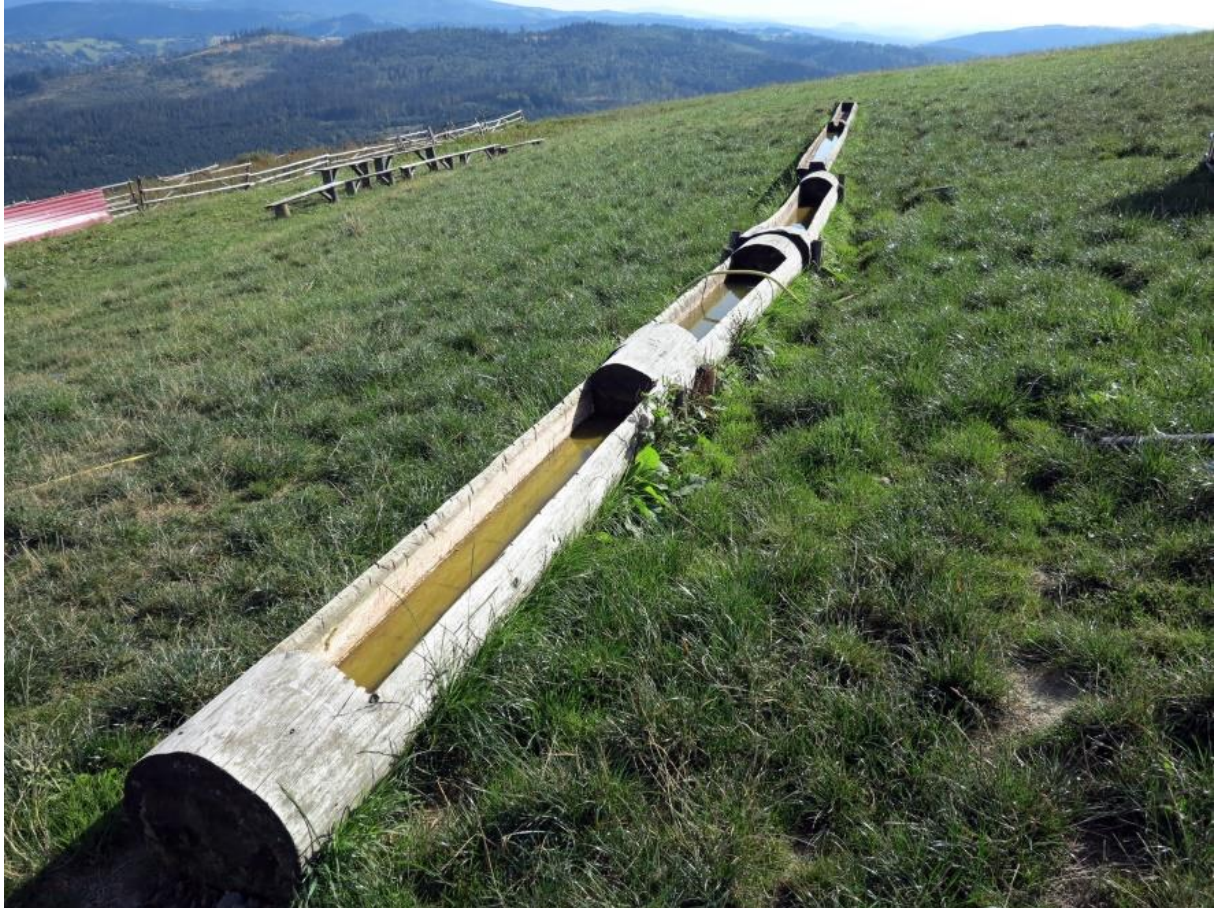
Fot. 11. Poidła dla owiec na Ochodzitej

Ochodzita góruje nad okolicznymi wzniesieniami przeciętnie 100-200 m ze względu na jej budowę geologiczną. Zbudowana jest ona z gruboławicowych, gruboziarnistych, wapnistych piaskowców krośnieńskich, znacznie odporniejszych na erozję niż skały, budujące jej otoczenie. Na północnych stokach Ochodzitej, poniżej trasy Koniaków - Milówka, w dolince tuż na wschód od osiedla Polana, znajduje się jedno z największych młodych osuwisk w Beskidzie Śląskim. Powstało ono w czasie dużych opadów deszczu w końcu lat 50. XX w.