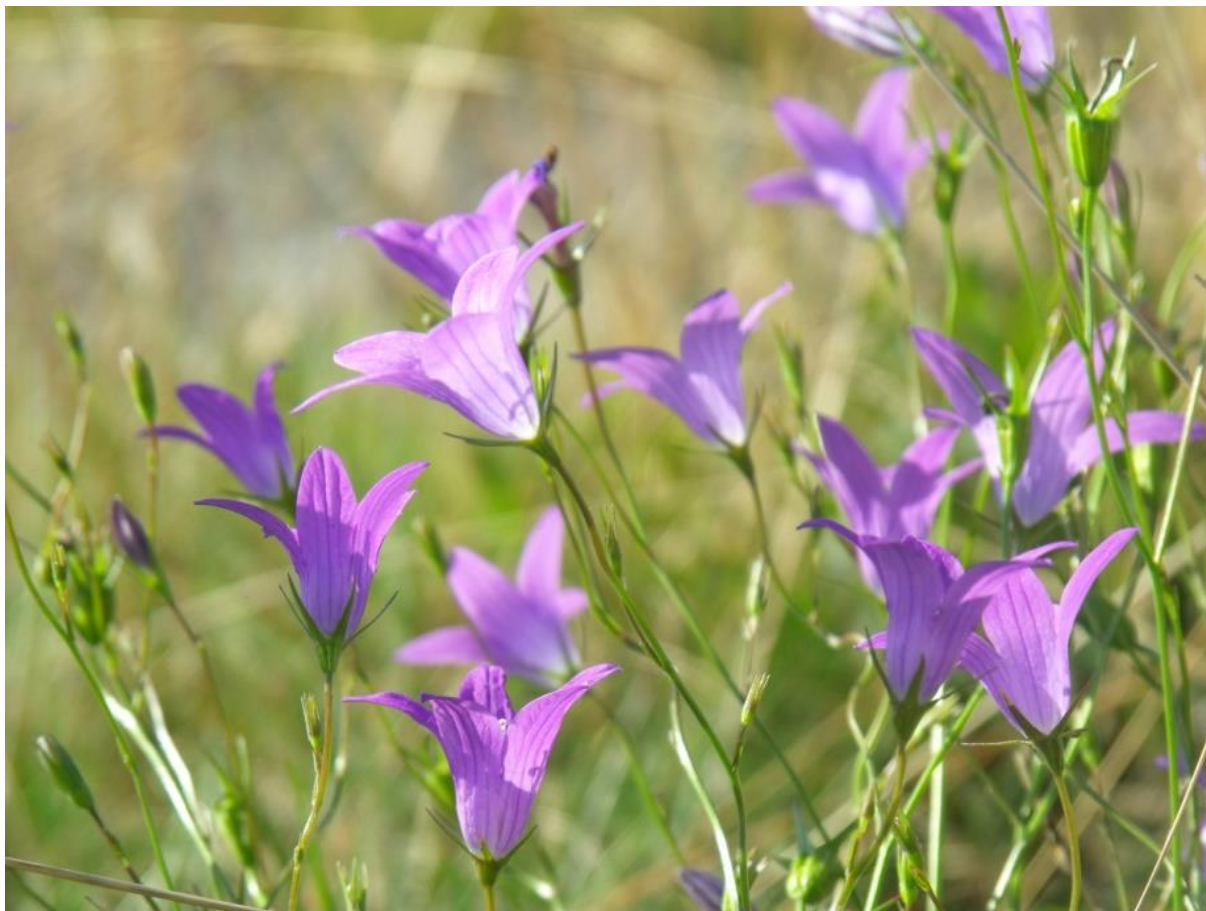
Fot. 67. Dzwonek rozpięzchły

do kilkudziesięciu osobników. Kwitnie od lipca do początku września w zależności od wysokości n.p.m. Jest owadopylny.