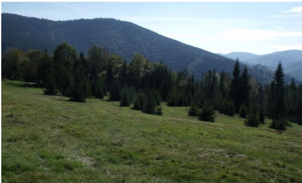
Fot. 69. Śródleśna polana w Beskidzie Żywieckim. Przełęcz Przysłop Potócki

Występowanie: niemal cała strefa umiarkowana Europy i znaczna część Azji, w Polsce najliczniej występuje w Karpatach, ale posiada wiele stanowisk rozproszonych po całym kraju