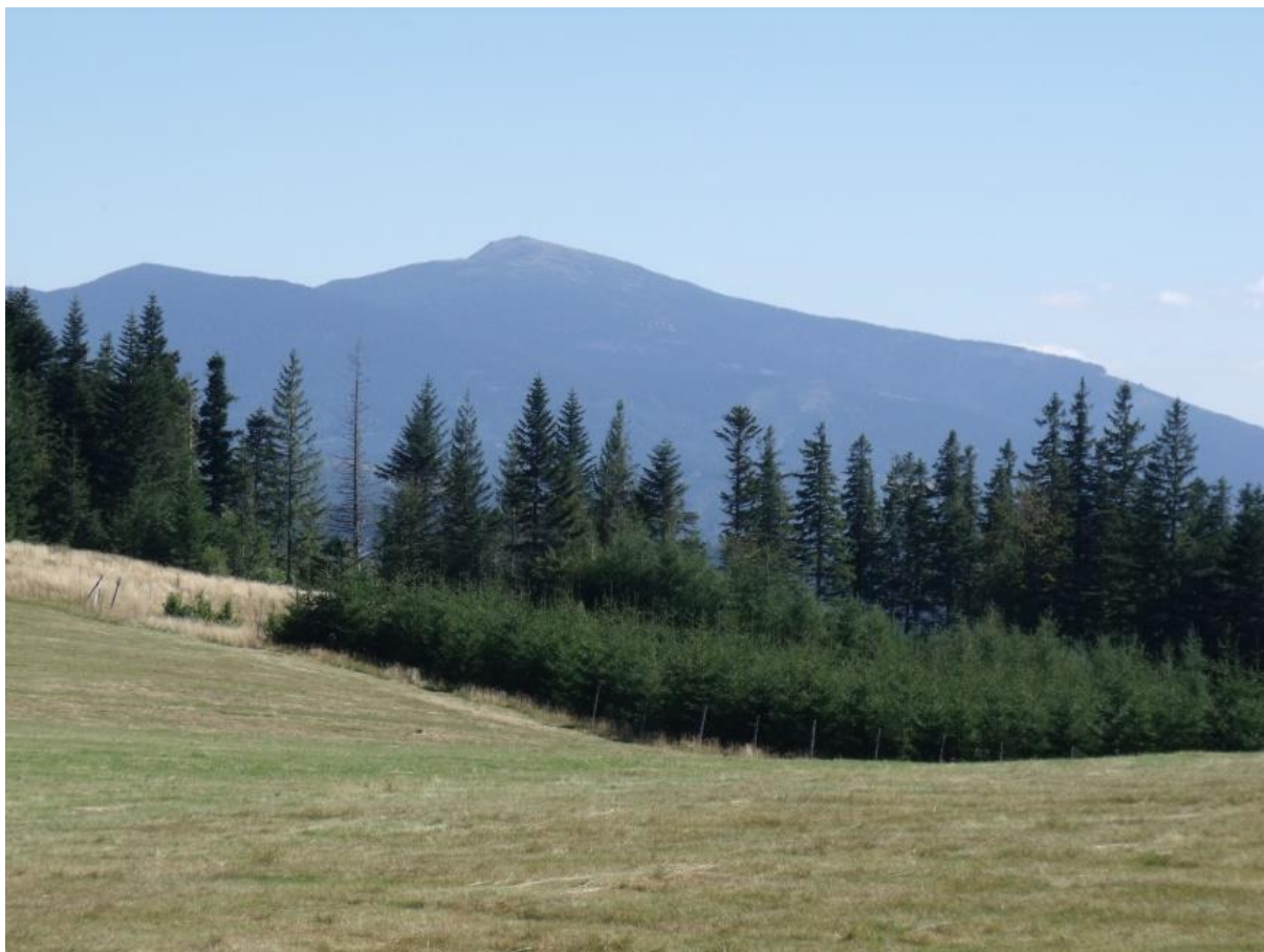
Fot. 52. Babia Góra widoczna z Hali Malorka

Kompleks rozległych hal położonych w grzbiecie górskim biegnącym na północ od Pilska, rozdzielającym doliny potoków Sopotnia Wielka i Glinne. Hale rozlokowane są w przyszczytowych partiach Malorki (1051 m n.p.m.) i na północno-wschodnich stokach Uszczawnego (1145 m n.p.m.).