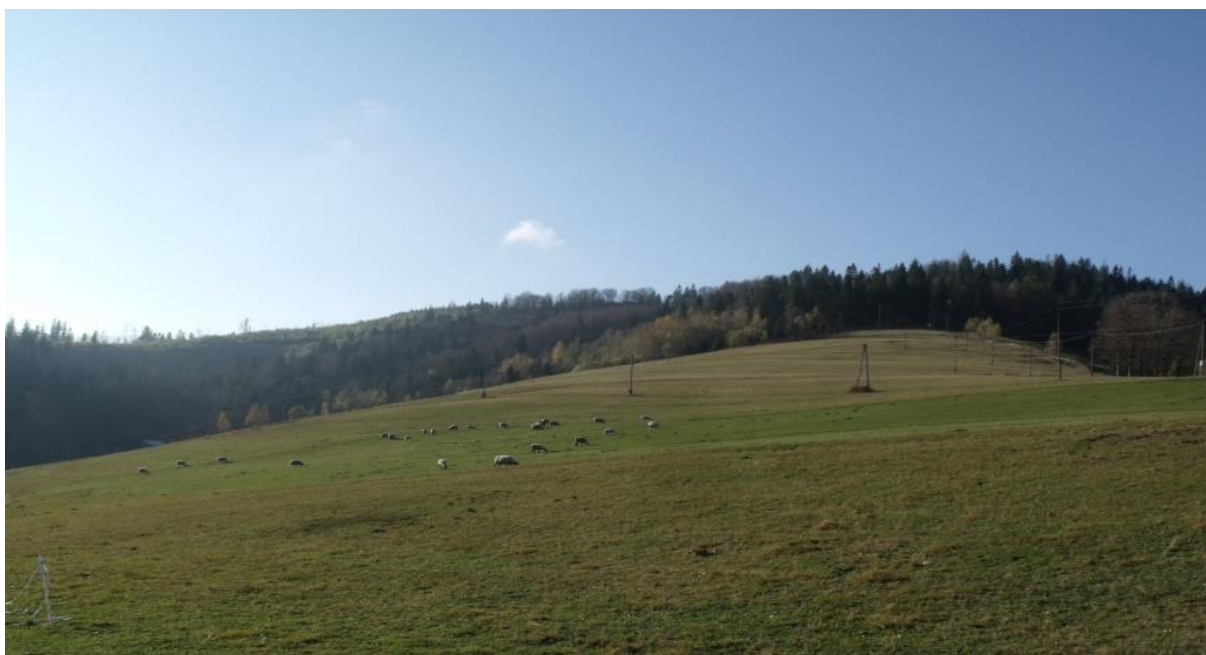
Fot. 10. Wypas owiec na Malince

Polana położona na północnych i północno-wschodnich stokach grzbietu bocznego odchodzącego od Gościejowa w kierunku doliny Leśnicy, na wysokości 630-700 m n.p.m.. Porasta ją cenna przyrodniczo łąka mieczykowo-mietlicowa Gladiolo-Agrostietum , łąka tomkowo-mietlicowa Anthoxantho-Agrostietum , zespół życicy i grzebienicy pospolitej Lolio-Cynosuretum oraz cenna zachodniokarpacka murawa bliźniczkowa Hieracio (vulgati)-Nardetum , a także zbiorowisko orlicy pospolitej Pteridium aquilinum . W górnej części polany występuje grupa starych jaworów kwalifikująca się do ochrony w formie pomnika przyrody. Przez polanę nie przebiega szlak turystyczny, znajduje się tu niewielki wyciąg narciarski.