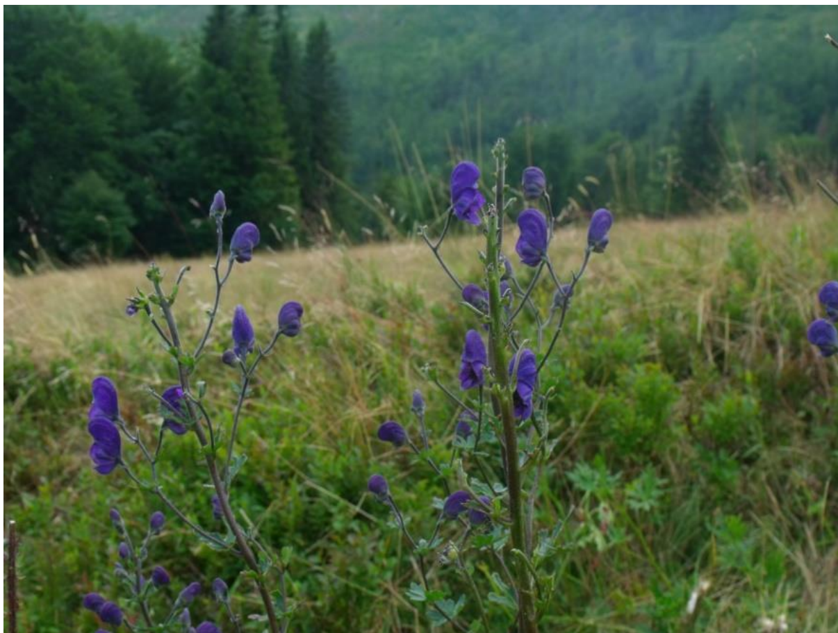
Fot. 77. Tojad

Charakterystyka ogólna : Posiada silną, nierozgałęzioną łodygę, osiągającą nawet 2 m wysokości. W jej górnej części znajduje się bujny kwiatostan, tworzony przez bardzo okazałe, fioletowe kwiaty, osiągające do 4 cm długości. Liście są silnie siecznie podzielone i ustawione skrętolegle. Kielich jest przekształcony w tzw. hełm, dlatego kwiaty tojadu były nazywane pantofelkami Matki Boskiej. Taka budowa kwiatów jest przystosowaniem do ich zapylania przez trzmiele.