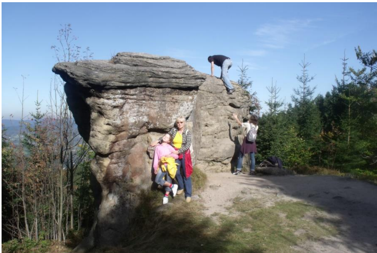
Fot. 82. Grzyby skalne na Kiczorach

Jaskinie zwane też dziurami, jamami czy piwnicami traktowane były jako skalne grotty prowadzące w nieznaną otchłań, utożsamianą ze sferą ciemności, demonów i śmierci. Były one wejściem do podziemi, a nawet samych piekieł, pilnowanych przed nadprzyrodzone moce. Często odwiedzali je czarownicy i znachorzy, aby nabrać magicznej mocy i zebrać specjalne akcesoria niezbędne do czarów.