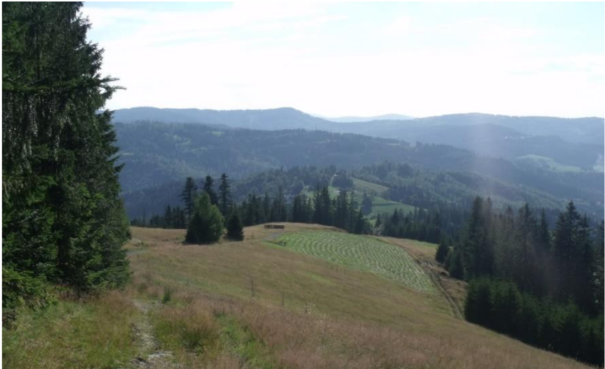
Fot. 5. Cieńków Postrzedni