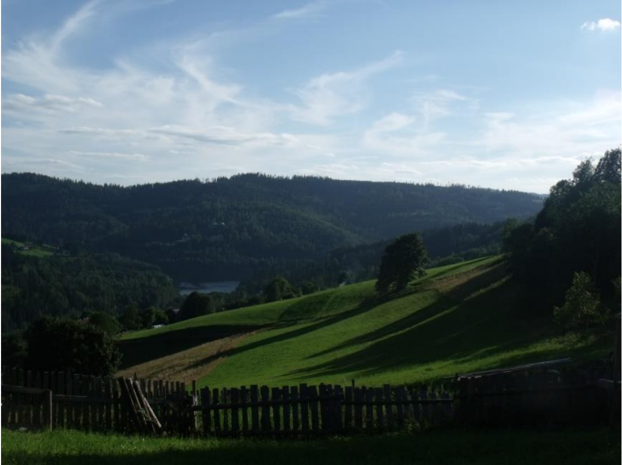
Fot. 4. Cienków Niżni

Polanę na Cieńkowie Postrzednim z kolei porasta głównie łąka tomkowo-mietlicowa Anthoxantho-Agrostietum . Spotkać tu można także cenną zachodniokarpacką murawę bliźniczkową Hieracio (vulgati)-Nardetum czy zbiorowisko dziurawca czterobocznego Hypericum maculatum . Ponadto miejscami występuje łąka mieczykowo-mietlicowa Gladiolo-Agrostietum , zbiorowisko orlicy pospolitej Pteridium aquilinum , zbiorowisko kłosówki miękkiej Holcus mollis i zbiorowisko situ skupionego Juncus conglomeratus . Polanę porasta także zbiorowisko borówki czarnej Vaccinium myrtillus i grupy świerka pospolitego Picea abies , co wynika z postępującego procesu sukcesji wtórnej lasu w miejscach nieużytkowanych. Z roślin chronionych spotkać można dziewięciśiła bezłodygowego Carlina acaulis i fałdownika nastroszonego Rhytidiadelphus squarrosus .