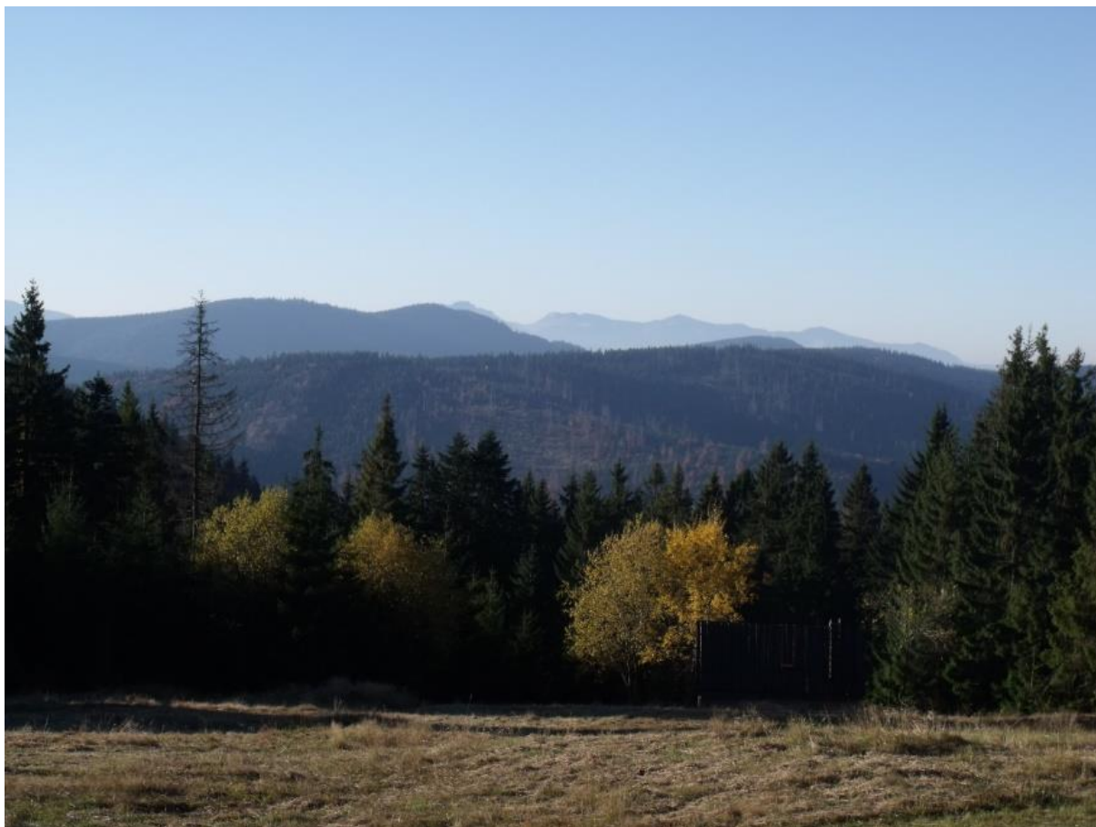
Fot. 37. Panorama Małej Fatry z Krawculi