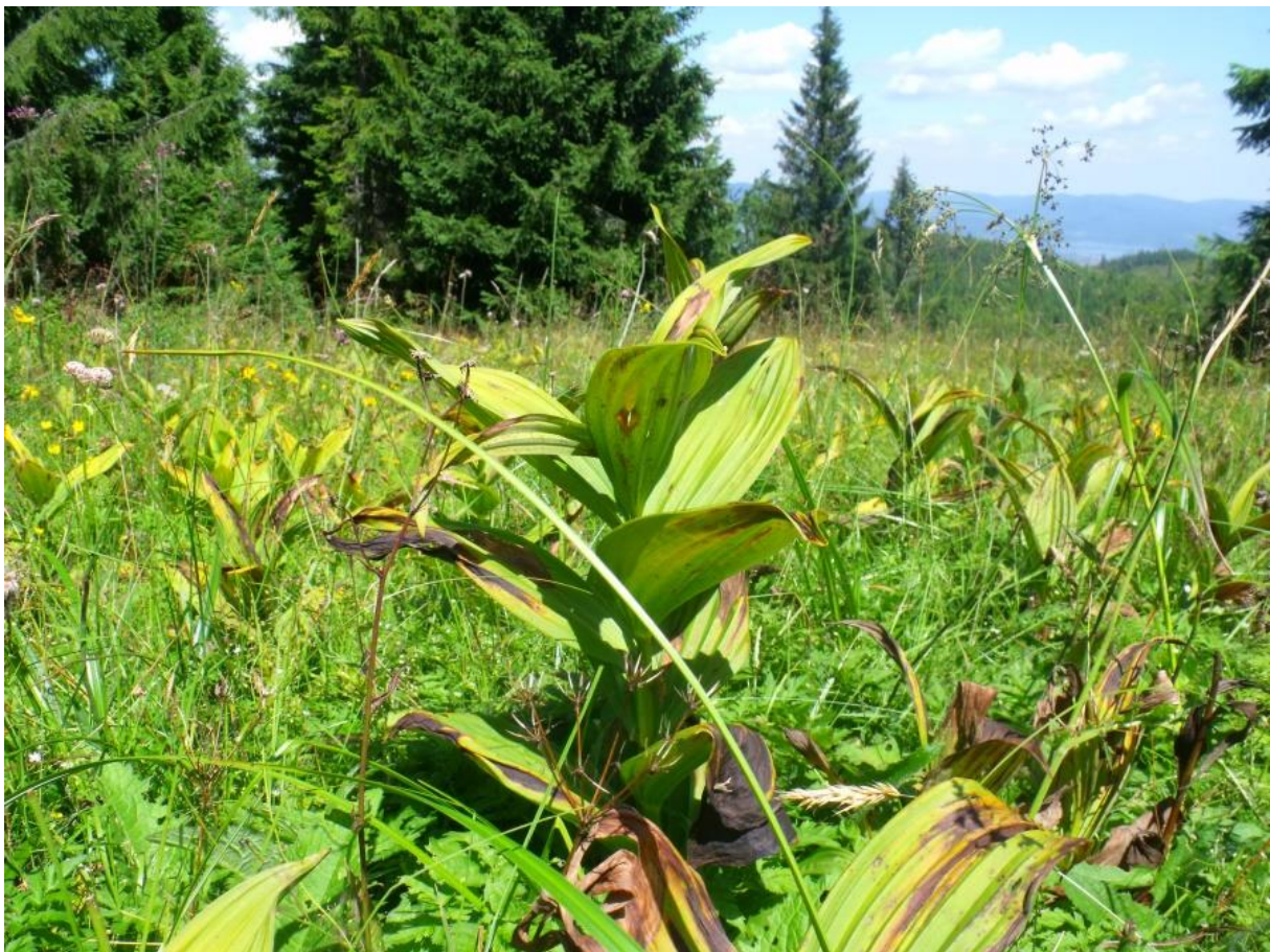
Fot. 64. Ciemiężyca zielona

Siedlisko: w Karpatach i Sudetach występuje od regla dolnego po piętro halne, zwłaszcza w piętrze kosówki, występuje licznie w ziołoroślach i traworoślach, zaroślach kosówki, na wilgotnych miejscach śródleśnych i brzegach potoków, łąkach górskich i halach, niezależnie od podłoża.