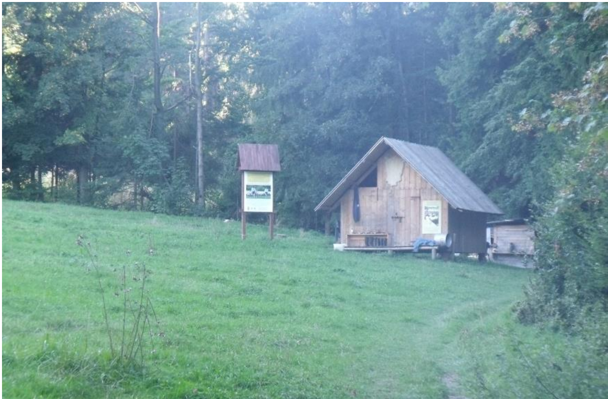
Fot. 30. Bacówka w Soblówce

Polany porasta cenna łąka mieczykowo-mietlicowa Gladiolo-Agrostietum i zachodniokarpacka murawa bliźniczkowa Hieracio (vulgati)-Nardetum . Można tu także zobaczyć miejscami zbiorowisko z kostrzewą czerwoną Festuca rubra i zespół turzycy sztywnej Caricetum rostratae . Występują także liczne grupy świerka pospolitego Picea abies , a niewielkie płyty tworzą zbiorowisko z wierzbą śląską Salix silesiaca i zbiorowisko z pokrzywą zwyczajną Urtica dioica . Z gatunków roślin chronionych występują kruszczyk szerokolistny Epipactis helleborine i goryczka trojeściowa Gentiana asclepiadea .