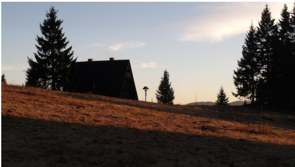
Fot. 36. Baczówka PTTK na Hali Krawculi

Z hali rozpościera się rozległa panorama w kierunku południowym, zachodnim i północno-zachodnim, a na horyzoncie widać szczyty Małej Fatry.