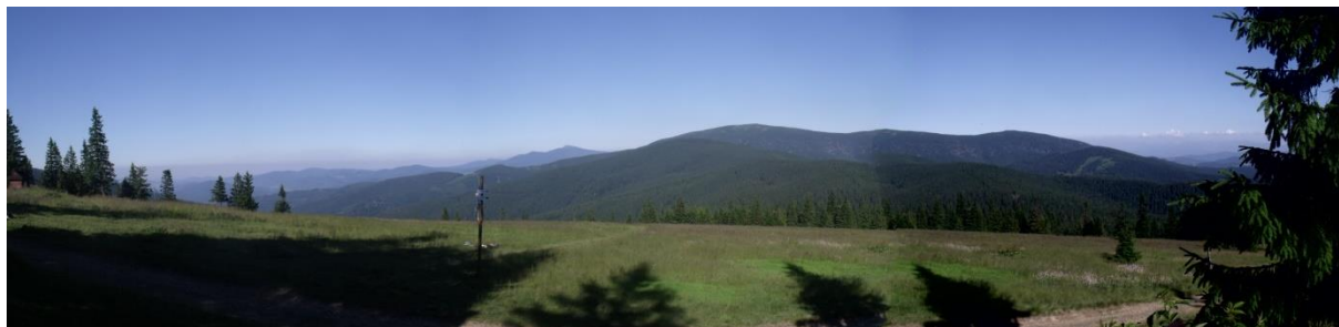
Fot. 50. Panorama z Hali Rysianka w kierunku Pilska i Babiej Góry

Rozległa hala położona na wschodnich i południowo-wschodnich zboczach Rysianki (1322 m n.p.m.), na wysokości od 1150 do 1260 m n.p.m. Jej nazwa, podobnie jak nazwa szczytu, pochodzą od rysia. Jest jedną z najbardziej widokowych hal w Beskidach. Panorama z niej obejmuje m.in. Pilsko, Babią Górę, a przy dobrej pogodzie również Tatry i góry Słowacji, w tym Małą Fatrę.