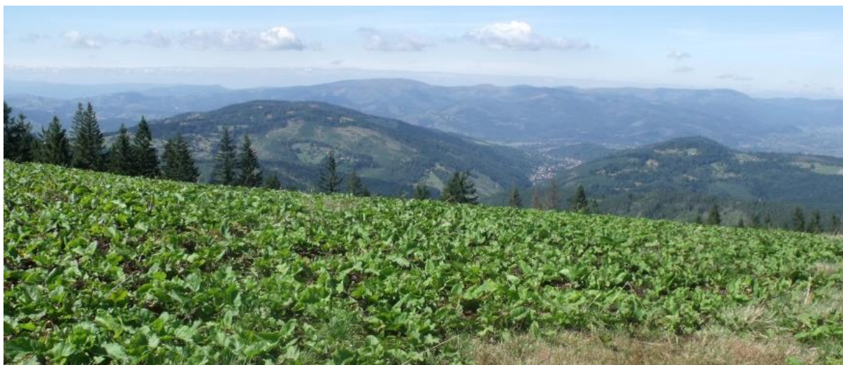
Fot. 42. Płaty szczawiu alpejskiego na Hali Pawlusiej

Kompleks dwóch hal położonych w obniżeniu pomiędzy Romanką a Rysianką. Hala Pawlusia rozpościera się na od przełęczy Pawlusiej (1176 m n.p.m.) do wysokości 1200 m n.p.m., natomiast Hala Łyśniowska leży na południowo-wschodnich stokach Martoszki na wysokości 1150-1250 m n.p.m. Nazwa Hali Pawlusiej pochodzi o nazwiska jednego z jej właścicieli.