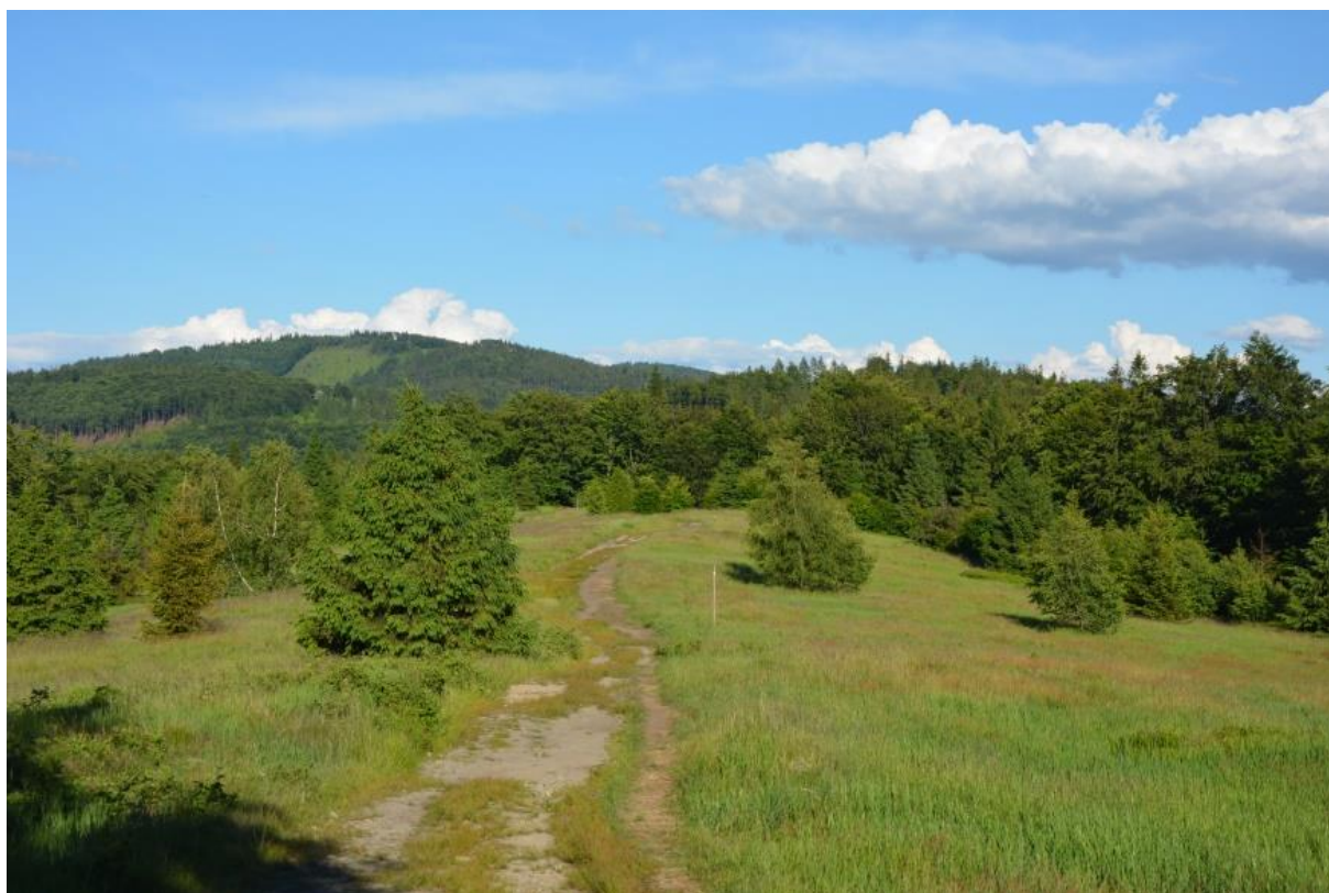
Fot. 3. Zarastająca polana na Cisowym Groniu

Ciąg widokowych polan rozciągający się na grzbiecie Błotnego (917 m n.p.m.), Wielkiej Cisowej (878 m n.p.m.) i Małej Cisowej (829 m n.p.m.) oraz stokach opadających w kierunku południowym i zachodnim (Brenna) na długości ok. 3 km. Na Cisowej Wielkiej mieszkańcy Brennej mieli swoje pierwsze górskie pastwisko, na którym paśli bydło rogate. Nazwa góry znana jest co najmniej od XVI w., określenie „ Sallasch Tissowa ” (Sałasz Cisowa) wspomina się w 1689 r., a nazwa przysiółka w poł. XIX w. Cały kompleks w przeszłości stanowił ważny ośrodek szalaśnictwa. Resztki zabudowań szalaśniczych widoczne są do dziś na Cisowej Małej.