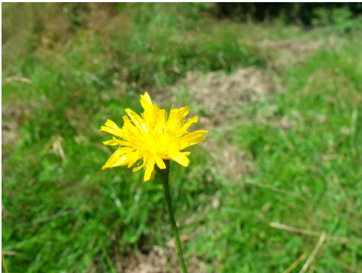
Fot. 58. Brodawnik zwyczajny