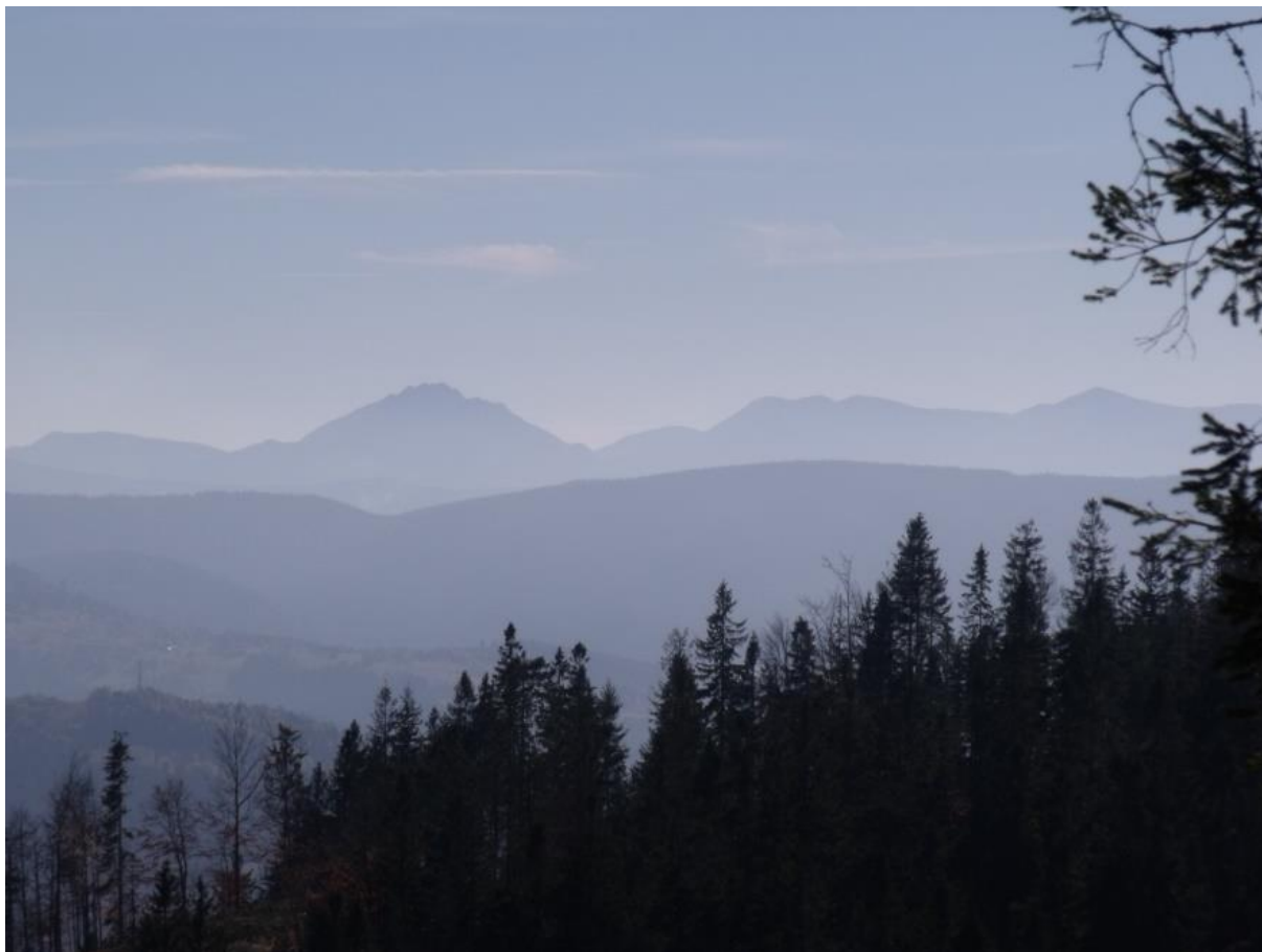
Fot. 48. Panorama Małej Fatry z Hali Redykalnej

Malownicza hala położona na południowo-zachodnim grzbiecie Redykalnego Wierchu (1146 m n.p.m.), na wysokości 1050-1100 m n.p.m. Jej nazwa związana jest ze słowem „redyk” oznaczającym wiosenne wyjście owiec na halę lub jesienny powrót z hali. Hala rozciąga się na długości pół kilometra, a jej szerokość osiąga 100-150 metrów. Z najwyższej położonej części hali roztacza się rozległa panorama na Worek Raczański i Beskid Śląski oraz Małą Fatrę.