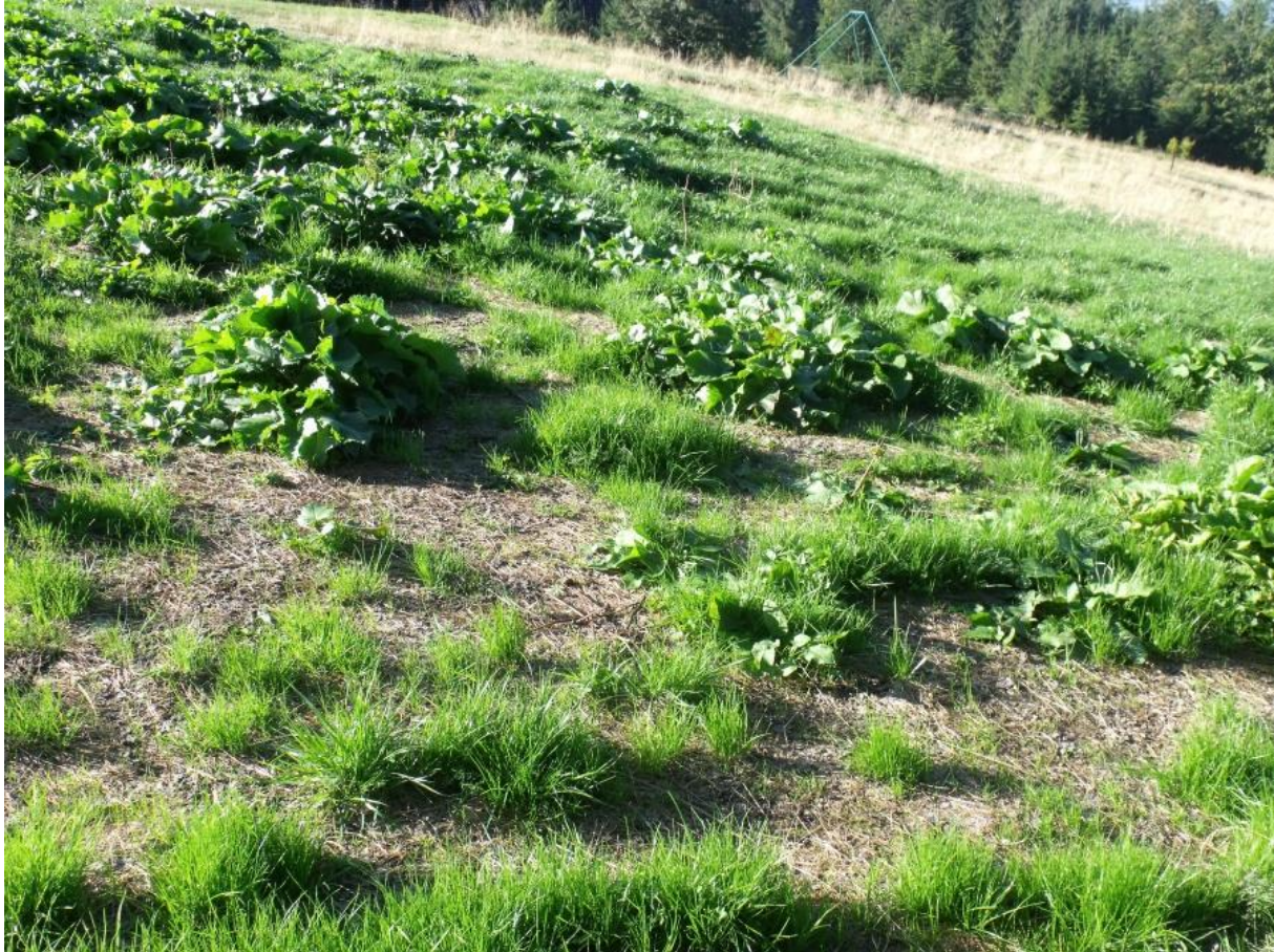
Fot. 24. Zniszczenia w pokrywie roślinnej na Polanie Buczynka

Część polany jest rozjeżdżona ze zniszczoną szatą roślinną. Przez polanę przebiega zielony szlak turystyczny z Korbielowa na Pilsko.