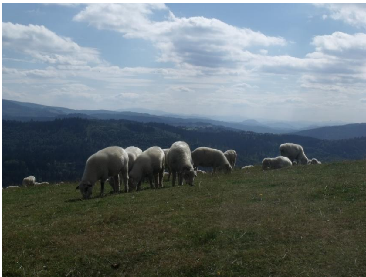
Fot. 12. Owce na Ochodzitej

w sierpniu, kiedy optimum kwitnienia ma chaber ostrołuskowy. Na obszarach źródliskowych, położonych w pobliżu Kosarzysk, w płatach eutroficznej młaki górskiej Valeriano-Caricetum flavae , można zaobserwować łanowo występującego storczyka – kruszczyka błotnego. U podnóża Ochodzitej, w miejscach wilgotnych i o mniejszym nachyleniu, spotyka się wilgotną łąkę ostrożeńiową Cirsietum rivularis , o fizjonomii której decyduje ostrożeń łąkowy, którego nasiona stanowią bazę pokarmową dla szczygłów. Ponadto występują tu łąka tomkowo-mietlicowa Anthoxantho-Agrostietum , zespół zycicy i grzebienicy pospolitej Lolio-Cynosuretum , zbiorowisko borówki czarnej Vaccinium myrtillus , zbiorowisko śmiatka darniowego Deschampsia caespitosa , zbiorowisko dziurawca czterobocznego Hypericum maculatum i zespół zycicy i rdestu Lolio-Plantaginetum . Zarośla tworzą wierzba iwa Salix caprea , świerk pospolity Picea abies , brzoza brodawkowata Betula pendula i jarząb pospolity Sorbus aucuparia . Z roślin chronionych występują dziewięciśń bezłodygowy Carlina acaulis i rokietnik pospolity Pleurozium schreberi .