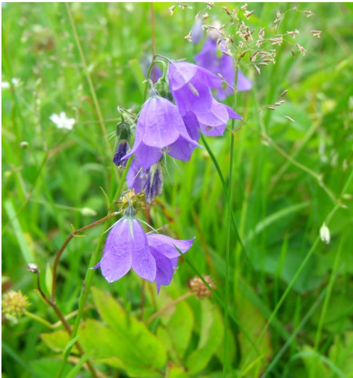
Fot. 66. Dzwonek piłkowany

Charakterystyka ogólna: Dzwonek piłkowany osiąga od 15 do 80 cm wysokości. Posiada zgrubiały korzeń główny i kłącze, wydające po kilka prostych pędów. Łodyga nieco kanciasta z owłosieniem, skrętolegle ulistniona. Liście łodygowe są sztywne, skórkowate i mają krótkoogonkowe, szerokolancetowate i ostro piłkowane blaszki. Kwiaty tworzą groniasty, rzadziej wiechokształny kwiatostan. Niebieskawofioletowa korona ma kształt dzwonkowaty jest rozcięta w górnej części na 5 łatek. Koronę otaczają cienkie zielone działki kielicha, 3 razy krótsze od korony. Dzwonek piłkowany rośnie pojedynczo lub tworzy skupienia liczące od kilku