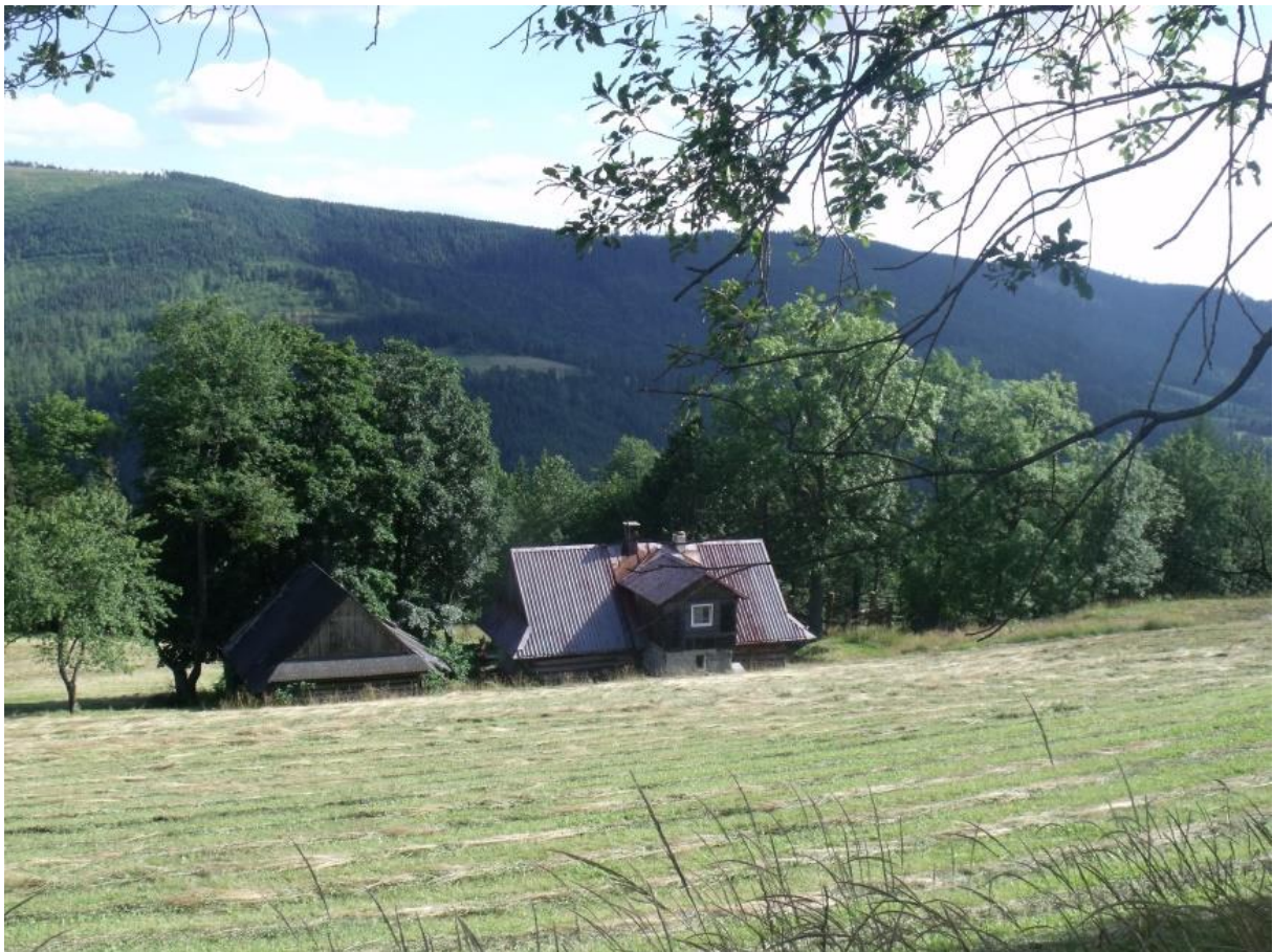
Fot. 6. Cieńków Wyżni