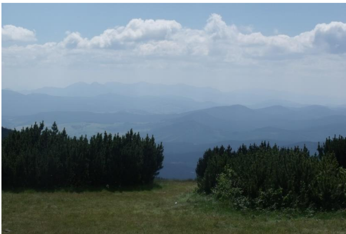
Fot. 74. Pilsko powyżej górnej granicy lasu

Występowanie: góry środkowej i południowej Europy, w Polsce: Sudety, Karpaty (Pilsko, Tatry, Pieniny, Bieszczady), dość częsty powyżej górnej granicy lasu, zwłaszcza w piętrze halnym; poza górami na Wyżynie Małopolskiej.