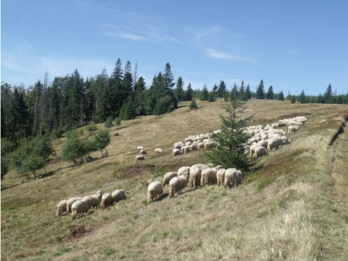
Fot. 16. Wypas owiec na Hali Radziechowskiej

Przez halę przebiega Główny Szlak Beskidzki na odcinku Węgierska Górka – Barania Góra. Można tu także dotrzeć niebieskim szlakiem z Radziechów.