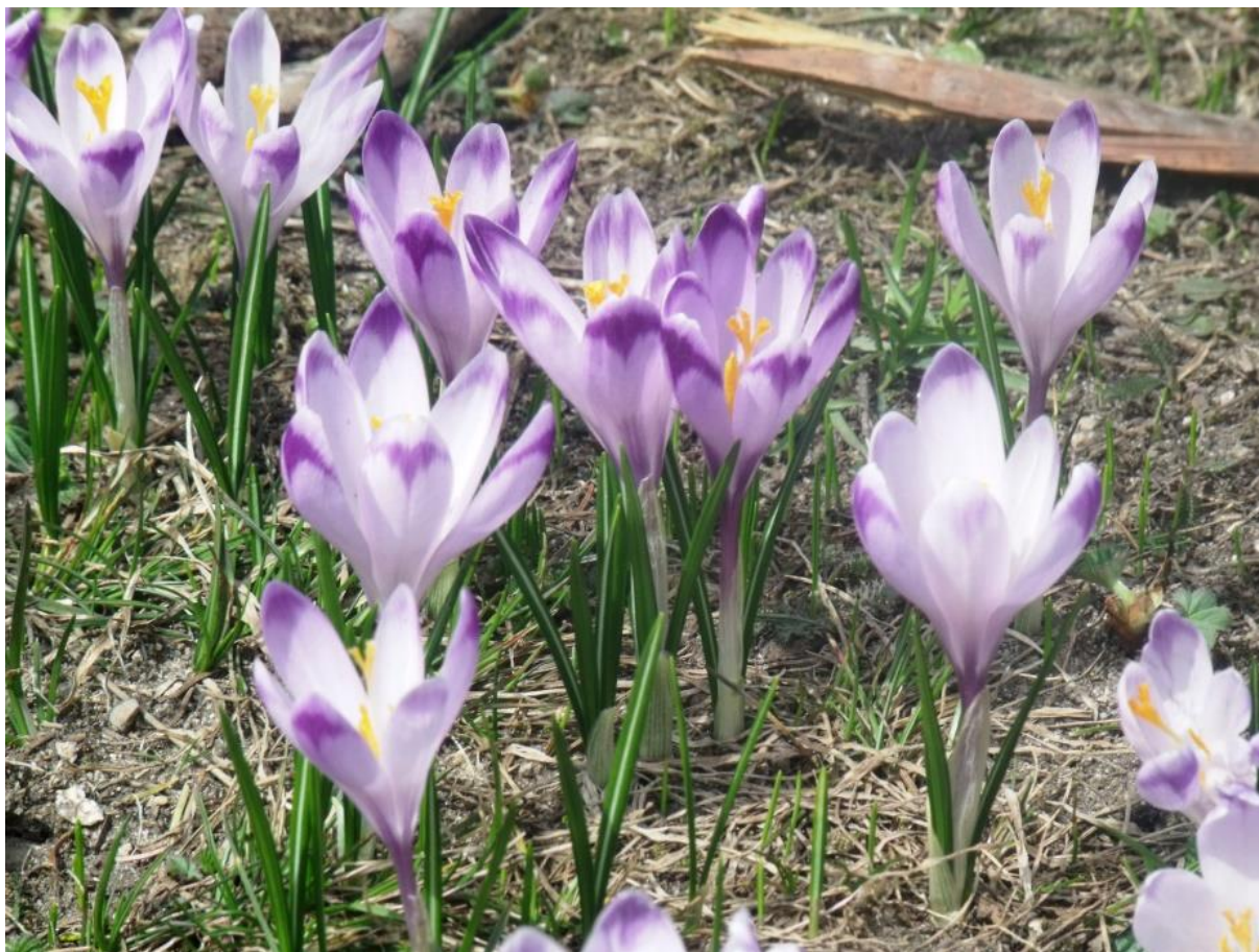
Fot. 75. Szafran spiski

Charakterystyka ogólna: Bardzo charakterystyczna roślina uznawana za jeden z pierwszych zwiastunów wiosny w górach. Krokus jest jedną z pierwszych roślin kwitnących w okresie przedwiośnia na polanach. Posiada podziemne bulwki, z których wyrastają wąskie, lancetowate liście z jasnym paskiem pośrodku. Następuje to po ustąpieniu śniegu. Zdarza się, że jego kwiaty wyrastają już na początku marca, często spod śniegu. Spomiędzy liści wyrasta bezlistny pęd zwieńczony pojedynczym, dużym kwiatem. Roślina osiąga do 20 cm wysokości. Kwiat ma kolor fioletowy lub rzadko biały i posiada 6 płatków. Często zdarza się, że w trakcie kwitnienia krokusów spada śnieg. Kwiaty zwijają się wtedy w pąki i rozwijają podobnie gdy śnieg stopnieje. Czasami nawet przebijają śnieg dzięki wydzielanemu ciepłu i kwitną w śniegu. Krokus jest zapylany przez różne gatunki owadów, m.in. przez trzmiele i pszczoły. Do krokusa podobny jest zimowit jesienny, także występujący na polanach, jednak krokus kwitnie wczesną wiosną, podczas gdy zimowit jesienią, często późną.