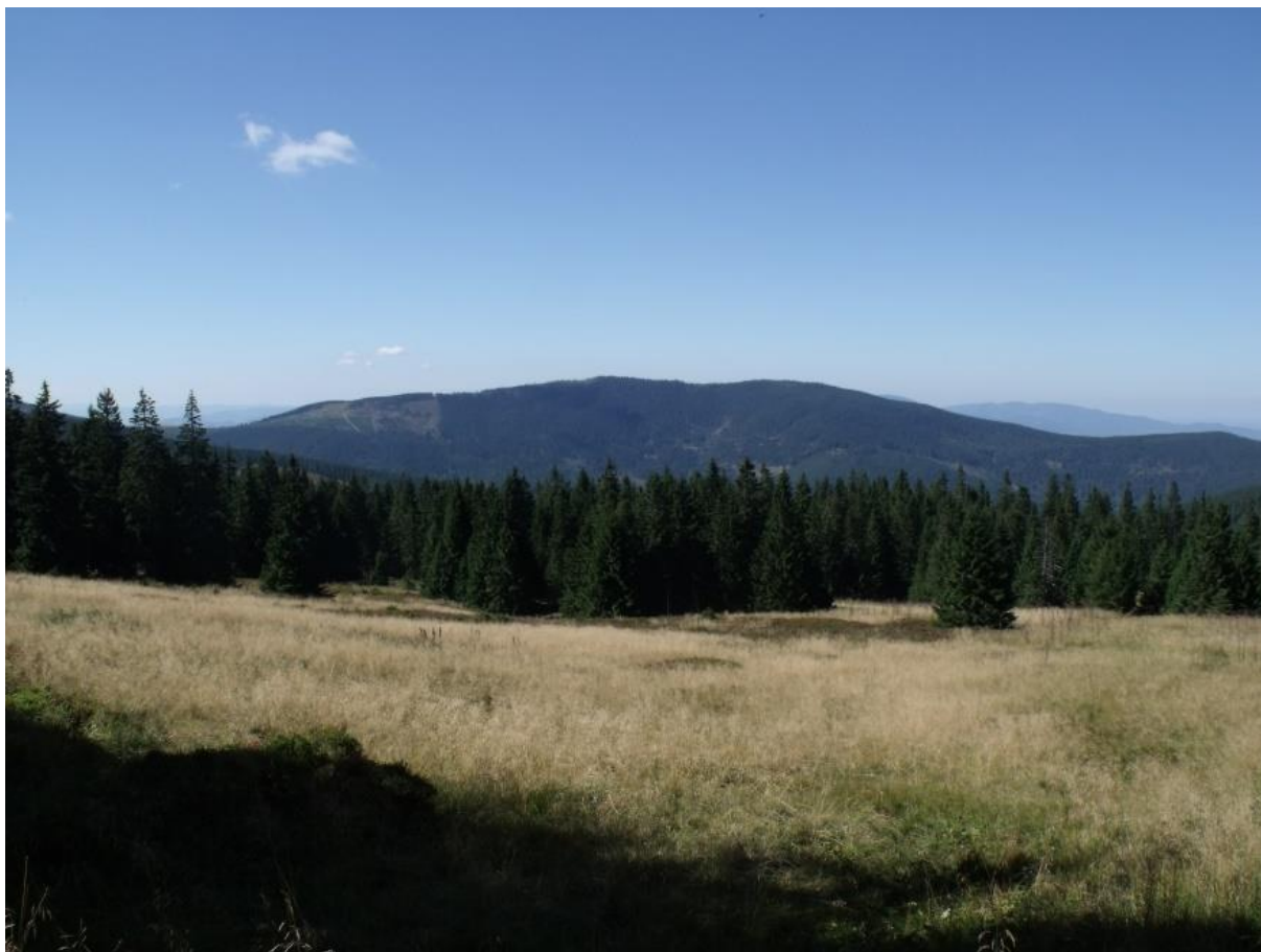
Fot. 25. Hala Cebulowa

spotkać kilka gatunków roślin chronionych – występują tu: czosnek syberyjski Allium sibiricum , niebielistka trwała Swertia perrenis , petnik alpejski Trollius altissimus , tojad mocny Aconitum firmum , goryczka trojeściowa Gentiana asclepiadea i kukułka Dactylorhiza sp. Z rzadkich w Polsce gatunków roślin stwierdzono także występowanie wierzbownicy zwieszanej Epilobium nutans .