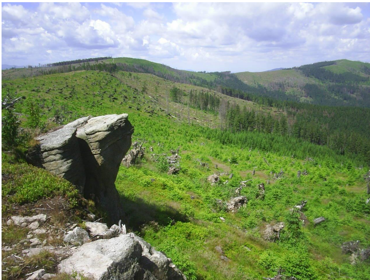
Fot. 83. Wychodnie skalne na Magurce Radziechowskiej

Szczególne miejsce w życiu pasterzy miał żywioł wody. Woda wypływająca z głębi ziemi miała moc oczyszczającą, natomiast spadająca w formie deszczu lub rosa – moc zapładniającą. Każda pasterska wspólnota otaczała opieką wodę, ponieważ miała ona istotne znaczenie dla pasterzy przebywających na hali. O lokalizacji hal w dużym stopniu decydowała dostępność wody, bliskość do źródeł. Miejsca źródliskowe, szczególnie tzw. zimne wody (miejsca, w których woda zimą nie zamarzała) pozwalały przez cały pobyt na halach mieć pewność, że nawet w trakcie suszy nie trzeba będzie schodzić na dół. W celu dobrego dostępu do wody ustawiano drewniane żłoby, przez które przepływała stale świeża woda. Wyjątkowe znaczenie miały również tzw. slanice, słone wody, które dostarczały wypasanim zwierzętom soli. Stąd do dziś – zarówno „zimna woda”, jak i „slanice” mają swoje stałe miejsca w kulturze pasterskiej Karpat i do dzisiaj baca na sałaszu wita się w pierwszej kolejności z wodą. Pasterzy obowiązywał zakaz mycia gielet w bieżącej wodzie, żeby mleko z nią nie odpłynęło. Woda, którą w szałasie płukano gielety, należało wylewać na krzyż przez wejście do koszar lub pod świerk, aby nie