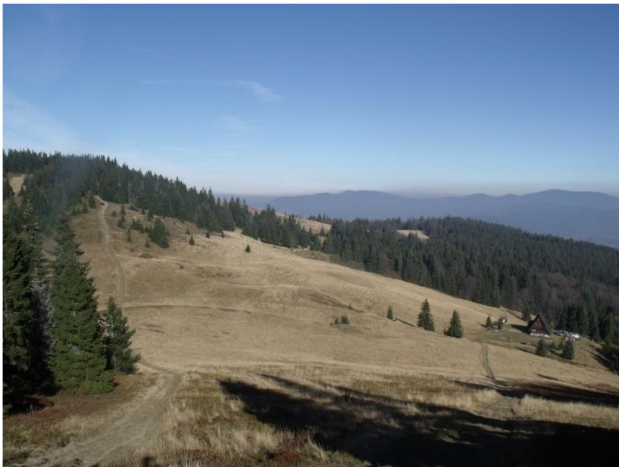
Fot. 49. Hala Rycerzowa

Większą powierzchnię hali zajmuje zachodniokarpacka murawa bliźniczkowa Hieracio (vulgati)-Nardetum . Z cennych przyrodniczo zbiorowisk występują także łąka mieczykowo-mietlicowa Gladiolo-Agrostietum , zespół turzycy pospolitej Caricetum nigrae (subalpinum) i żyzna młaka górska (młaka kozłkowo-turzycowa) Valeriano-Caricetum flavae . W wielu miejscach halę pokrywają borówczyska Vaccinium myrtillus . Na hali występuje kilka gatunków roślin chronionych: dzwonek piłkowny Campanula serrata , dziewięciśń bezłodygowy Carlina acaulis , kukułka szerokolistna Dactylorhiza majalis i storczyca kulista Trausteinera globosa . Na uwagę zasługuje też rzadko występujący ostrożeń głowacz Cirsium eriophorum .