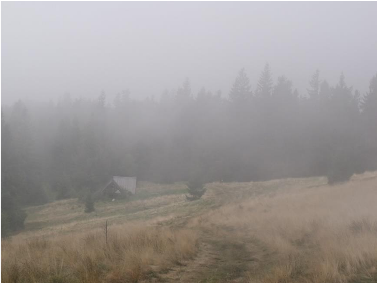
Fot. 33. Hala Janoszkowa

Halę porasta głównie zbiorowisko mietlicy pospolitej i kostrzewy czerwonej Agrostis capillaris - Festuca rubra . Z cennych zbiorowisk występuje zachodniokarpacka murawa bliźniczkowa Hieracio (vulgati)-Nardetum , a przy wspomnianym źródleku żyzna młaka górską (młaka kozłkowo-turzycowa) Valeriano-Caricetum flavae . Znaczną powierzchnię hali porastają borówczyska Vaccinium myrtillus . Niewielkie płaty zajmują zbiorowisko z kłosówką miękką Holcus mollis , zbiorowisko z śmiatką darniowym Deschampsia cespitosa i kępy situ rozpięzchłego Juncus effusus . Z gatunków chronionych roślin spotkać można goryczkę trojeściową Gentiana asclepiadea , kukułkę szerokolistną Dactylorhiza majalis i dziewięciśia beztłodygowego Carlina acaulis .