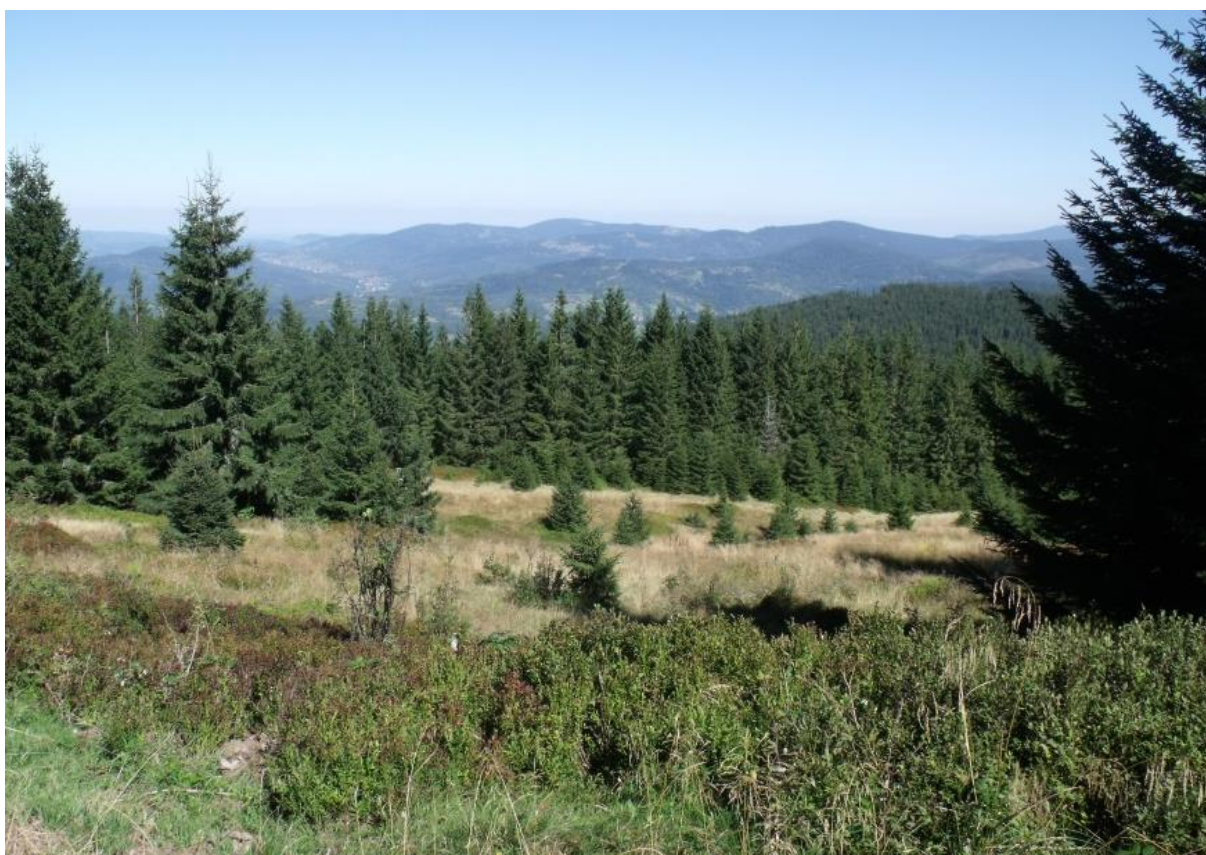
Fot. 32. Postępująca sukcesja wtórna lasu na Hali Górowej