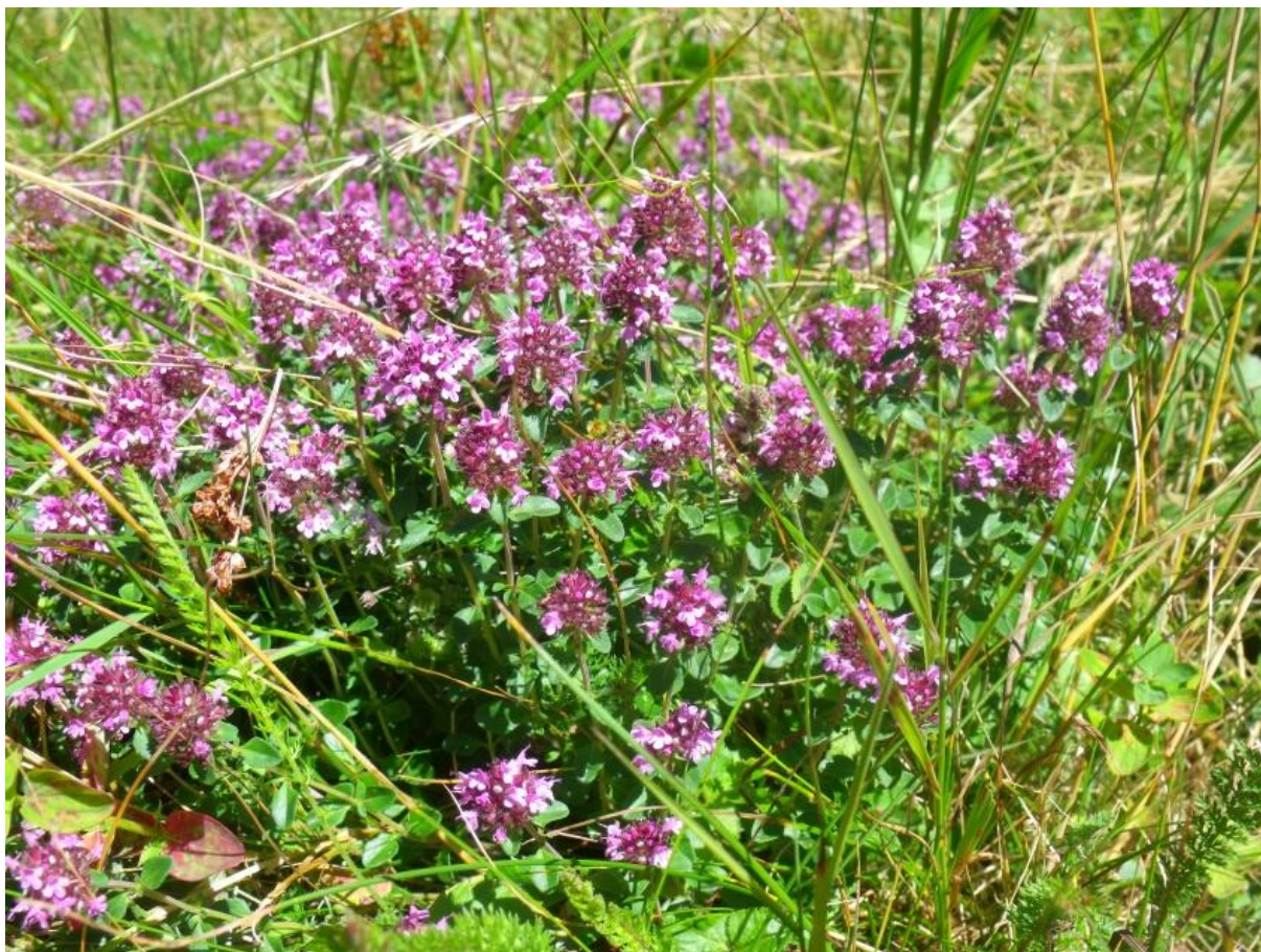
Fot. 56. Macierzanka