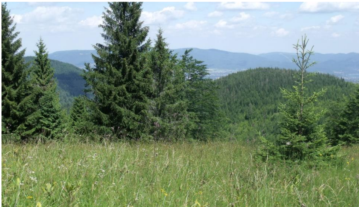
Fot. 70. Polana Cebula w Beskidzie Śląskim

Siedlisko: prawie na całym obszarze, w górach po regiel dolny, wyjątkowo w reglu górnym; jest składnikiem torfowisk niskich na podłożu zasobnym w węglan wapnia oraz mokrych łąk i podmokłych zarośli.