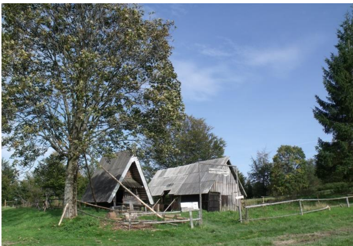
Fot. 47. Baza namiotowa na Przysłopie Potóckim