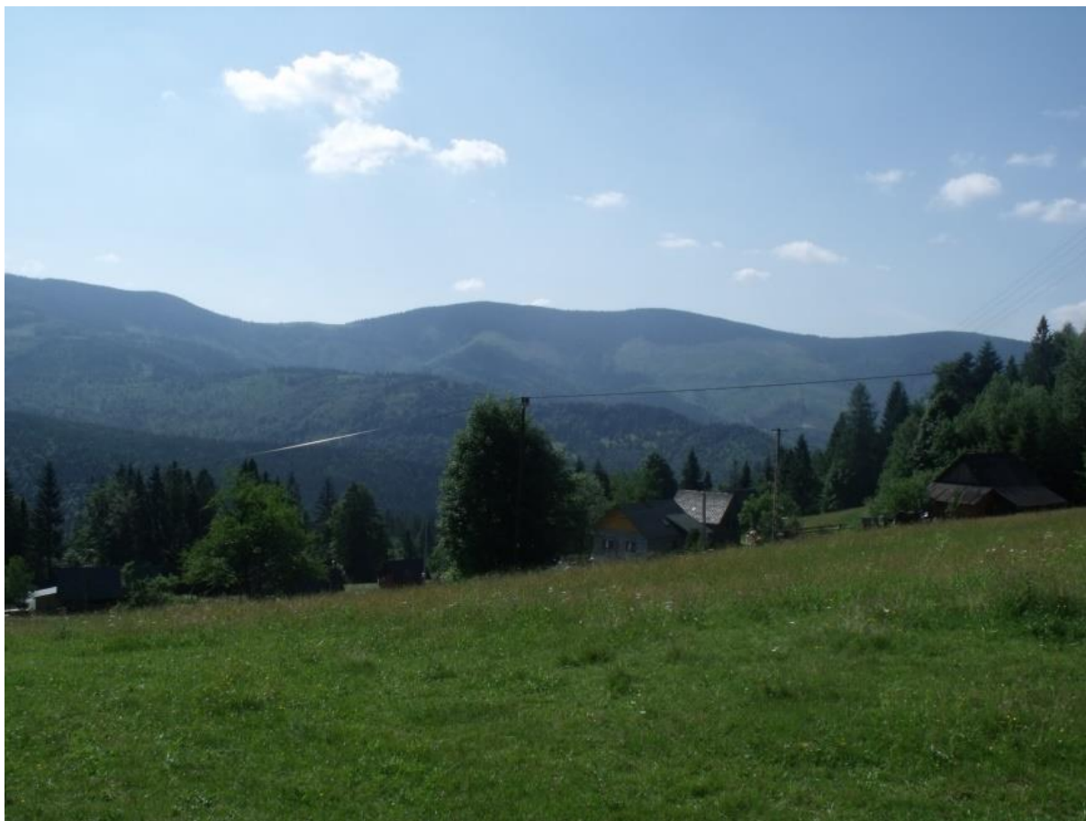
Fot. 20. Abrahamów

Przez polany przebiega czerwony Główny Szlak Beskidzki na odcinku Węgierska Górka – stacja turystyczna „Słowianka” i dalej w kierunku Hali Rysianki oraz Transbeskidzki Szlak Konny.