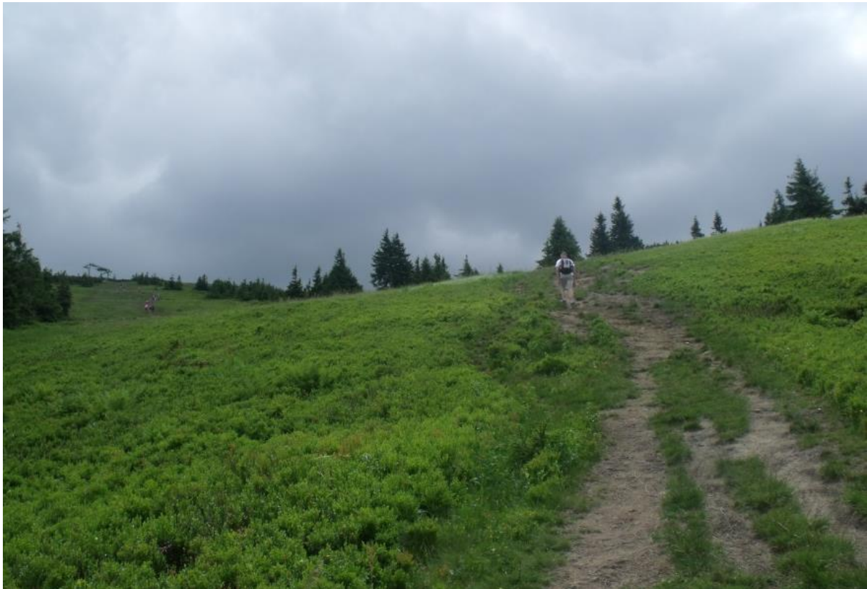
Fot. 71. W masywie Pilska

Występowanie: gatunek euro-azjatycki, w Polsce na całym obszarze, częsta w Beskidach Zachodnich, bardzo licznie występuje na polanach w masywie Pilska.