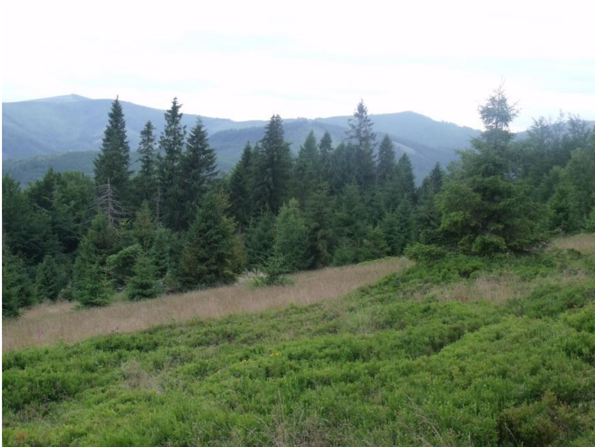
Fot. 9. Hala Jaskowa zarastająca borówczyskami

Hala Jaworzyna – rozległa widokowa polana na północno-zachodnim ramieniu Skrzycznego. Do lat 50. XX w. była ona intensywnie wypasana. Współcześnie znajduje się tutaj pośrednia stacja wyciągu krzesółkowego na Skrzyczne, górna stacja wyciągu narciarskiego i skrzyżowanie kilku narciarskich tras zjazdowych. W pobliżu polany znajduje się pomnik przyrody nieożywionej – Jaskinia w Jaworzynie oraz liczne zapadliska i rumowiska skalne. Przez polanę przebiega niebieski szlak z Szczyrku na Skrzyczne.