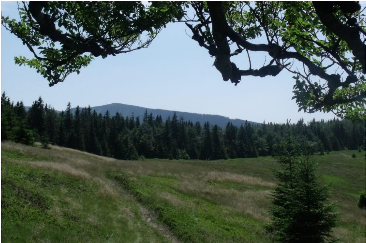
Fot. 35. Hala Kamińskiego

Halę porastają głównie zbiorowisko z kłosówką wełnistą Holcus lanatus , zbiorowisko mietlicy pospolitej i kostrzewy czerwonej Agrostis capillaris-Festuca rubra oraz cenna zachodniokarpacka murawa bliźniczkowa Hieracio (vulgati)-Nardetum . Znaczną część hali porasta zbiorowisko borówki czarnej Vaccinium myrtillus . Ponadto występuje tu zbiorowisko z maliną właściwą Rubus idaeus i jeżyną fałdowaną Rubus plicatus , a także zespół sitowia leśnego Scirpetum sylvatici i ostrożenia błotnego Cirsium palustre oraz zbiorowisko kosmatki obrzymiej Luzula sylvatica . Z roślin chronionych występuje goryczka trojeściowa Gentiana asclepiadea .