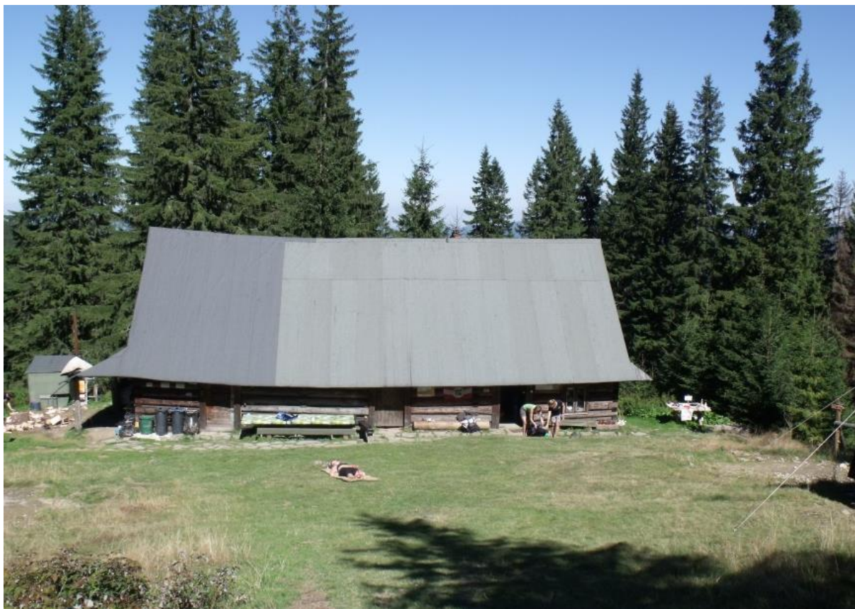
Fot. 31. Baza namiotowa na Hali Górowej