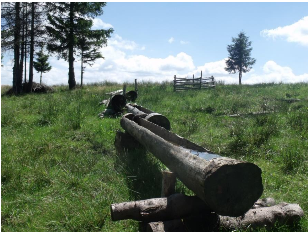
Fot. 61. Kwaśna młaka górską na Hali Radziechowskiej

Ze względu na różnice w fizjonomii wynikające z różnego składu gatunkowego, wyróżnić można dwa podzespoły kwaśnych młak górskich. Pierwszy z nich Carici canescentis-Agrostietum caninae typicum jest uboższy i bardziej kwaśny. Wykształca się on w dolinach i na stokach, najczęściej w miejscach płaskich lub o słabym nachyleniu. Warstwa zielna jest słabiej rozwinięta i osiąga pokrycie 50-90%. Na ogół dominuje w niej wełnianka wąskolistna Eriophorum angustifolium lub turzyca pospolita Carex nigra . Poza tym można tu spotkać fiołka błotnego Viola palustris , turzycę gwiazdkowatą Carex echinata i mietlicę psią Agrostis canina . Na uwagę zasługuje też owadożerna rosziczka okrągłolistna Drosera rotundifolia . Bardzo dobrze rozwinięta jest warstwa mszysta, którą tworzą najczęściej torfowiec kończysty Sphagnum fallax lub płonnik pospolity Polytrichum commune . Drugi podzespół kwaśnych młak górskich Carici canescentis-Agrostietum caninae dactylorhizetosum majalis jest żyźniejszy i bardziej barwny. Zlokalizowany jest na stokach o większym nachyleniu niż wariant typowy. W jego obrębie występują takie gatunki jak kukułka szerokolistna Dactylorhiza majalis , niezapominajka błotna Myosotis palustris , przytulia błotna Galium palustre i skrzyp błotny Equisetum palustre . Warstwa zielna jest bardziej bujna. Można tu spotkać także turzycę