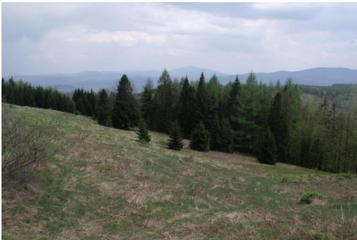
Fot. 15. Hala Ostre

Przez halę przebiega zielony szlak turystyczny z Ostrego na Magurkę Radziechowską. Rozpościera się stąd widok na Beskid Żywiecki z dominującym masywem Babiej Góry. Na hali znajduje się kilka szopek na siano, które współcześnie użytkowane są przez mieszkańców pobliskich wsi.