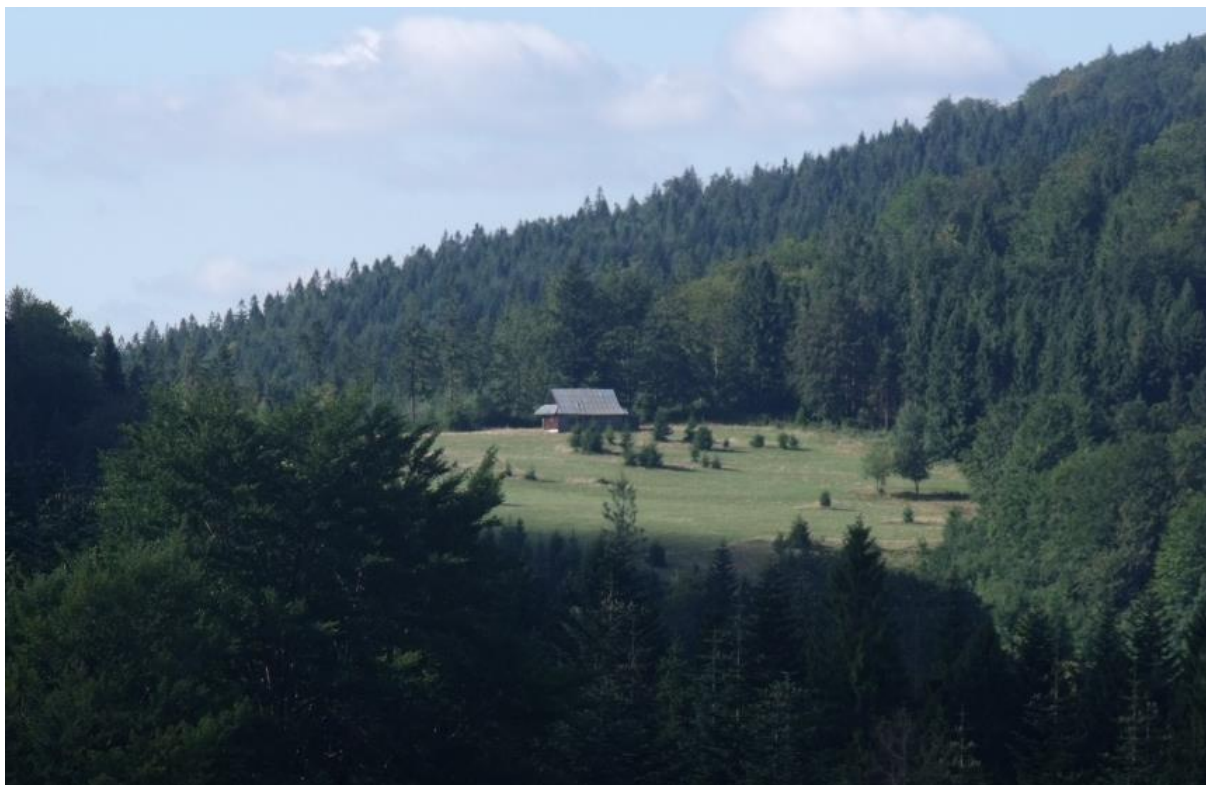
Fot. 29. Hala Cukiernica

Hala jest dobrym punktem widokowym na Grupę Romanki i Lipowskiego Wierchu, Suchą Górę oraz doliny Żabnicy i Soły. Na Hali Boraczej znajduje się schronisko turystyczne PTTK zbudowane w 1934 r. Stanowi ona zatem węzeł szlaków turystycznych: można tu dotrzeć niebieskim szlakiem z Węgierskiej Górki przez Prusów, biegnącym dalej przez Halę Cudzichową i Suchą Górę do Rajczy, zielonym szlakiem z Milówki przebiegającym dalej w kierunku Rysianki oraz czarnym z Żabnicy. Hala stanowi doskonały punkt wypadowy w kierunku Rysianki, czarnym a następnie żółtym, będącym jednym z najbardziej widokowych szlaków w Beskidach. Do przysiółka Milówki zlokalizowanego w dolnej części hali prowadzi droga asfaltowa z Żabnicy Skątki, co sprawia, że coraz częściej przed schroniskiem można spotkać samochody osobowe. W okolicach hali znajduje się najbardziej znana jaskinia Beskidu Żywieckiego – Jaskinia w Boraczej.