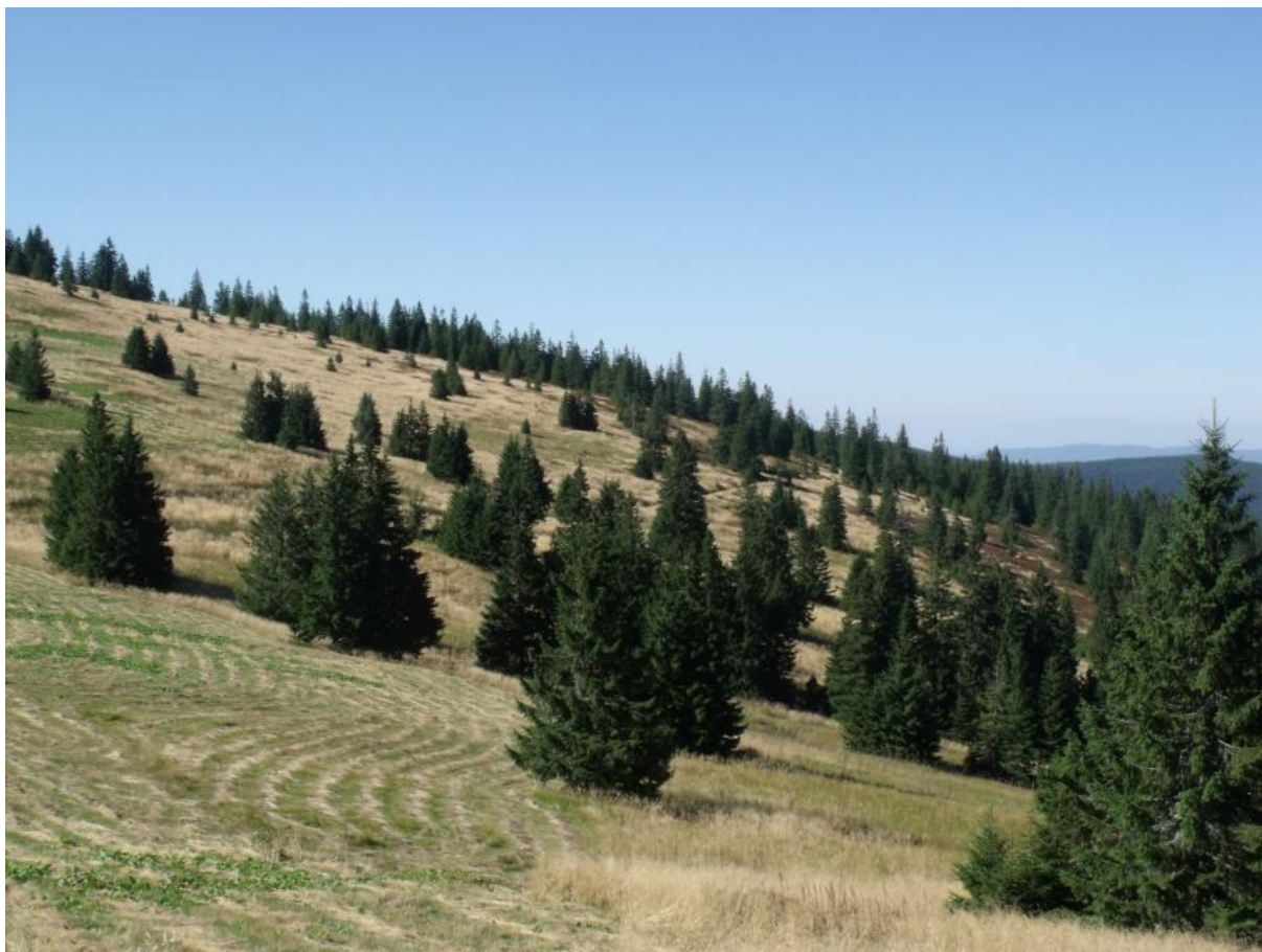
Fot. 79. Hala Cudzichowa w grupie Pilska

Kluczową cechą siedliska warunkującą występowanie siwerniaka wydaje się obecność w siedlisku łągowym wysoko położonych obszarów porośniętych przez niską roślinność trawiastą – górskich i wysokogórskich łąk i muraw. Miejsca te są preferowanym żerowiskiem, które stanowi zasobniejsze źródło pokarmu niż krzewiaste górskie zarośla czy powierzchnie skaliste, przekładając się na wyższy sukces reprodukcyjny wykorzystujących je ptaków. Przeprowadzone w latach 90. ub. wieku badania wykazały, że na Pilsku populacja siwerniaka wynosi ok 20-25 par. Na Hali pod Kopcem siwerniak osiąga zagęszczenie 4,1 pary/10 ha i jest trzecim z kolei dominującym gatunkiem ptaka na tym obszarze. Na położonej niżej Hali Miziowej jego zagęszczenie wprawdzie spada do 3,8 pary/10 ha, jednakże jest on tu gatunkiem dominującym, obejmującym 1/3 wszystkich par łągowych występujących tutaj gatunków.