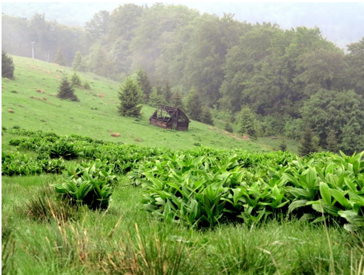
Fot. 7. Mała Czantoria

Polany na Czantorii w głównej mierze pokrywa łąka tomkowo-mietlicowa Anthoxantho-Agrostietum . W kilku miejscach można zaobserwować szczególnie cenną zachodniokarpacką murawę bliźniczkową Hieracio (vulgati)-Nardetum . Niewielkie płyty zajmuje zbiorowisko z orlicą pospolitą Pteridium aquilinum oraz zespół szczawiu alpejskiego Rumicetum alpini . Polany miejscami pokrywają grupy buka zwyczajnego Fagus sylvatica , świerka pospolitego Picea abies , klonu jawora Acer pseudoplatanus oraz zbiorowiska borówki czarnej Vaccinium myrtillus .