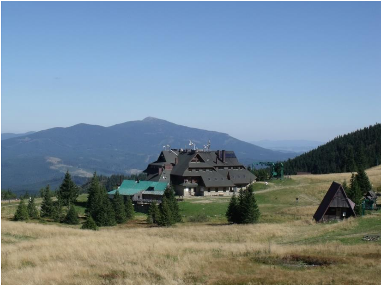
Fot. 39. Hala Miziowa ze schroniskiem PTTK

Hale tworzą jeden duży kompleks położony u północnych podnóży kopuły szczytowej Piłska (Hala Miziowa) i na jej północnych stokach (Hala Słowikowa). Niekiedy cały kompleks hal określa się Halą Miziową, natomiast w niektórych opracowaniach wyróżnia się mniejsze jednostki jak Hala Słowikowa czy polana Między Młaki. Najwyższa część całego kompleksu hal sięga wysokości 1300 m n.p.m.