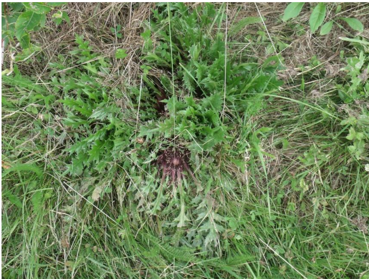
Fot. 65. Dziewięsił bezłodygowy

Charakterystyka ogólna: Roślina o charakterystycznych koszyczkach kwiatowych i promieniście rozłożonych kłujących liściach. Posiada mocny palowy korzeń o silnie zredukowanej łodydze, wysokości zaledwie do 3 cm. Liście są płasko rozpostarte na ziemi, zebrane w różyczkę o średnicy 30-40 cm, szarzielone od pajęczynowego owłosienia, w zarysie lancetowate, pierzastosieczne, kolczaste, zbiegające w ogonek. W środku różyczki liściowej znajduje się jeden duży koszyczek średnicy do 15 cm, wyrastający na szczycie skróconej łodygi. Okrywa koszyczka utworzona jest z listków zewnętrznych kolczastych, podobnych do liści oraz wewnętrznych szeroko rozpostartych, słomianych, srebrzystobiałych lub z różowym odcieniem. Kwiaty czerwone. Roślina kwitnie w sierpniu i wrześniu.