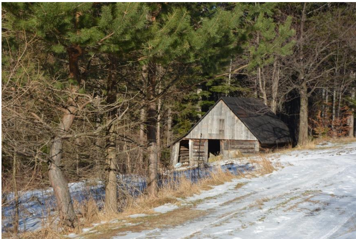
Fot. 76. Polana Przystęp w Beskidzie Śląskim zimą

Występowanie: środkowa i południowa Europa, Kaukaz, Azja Mniejsza, w Polsce w Sudetach, Karpatach oraz na Nizinie Śląskiej, w Kotlinie Sandomierskiej, na wyżynach oraz w Wielkopolsce.