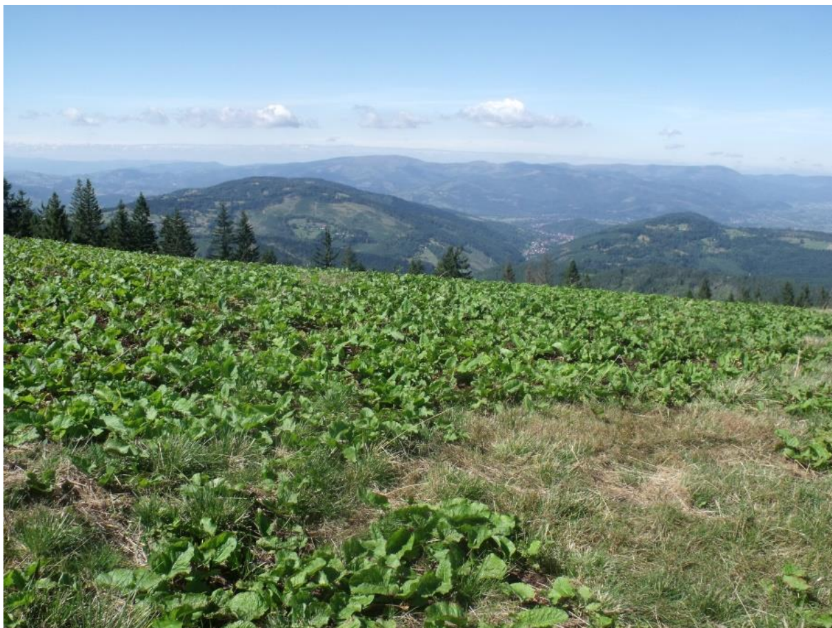
Fot. 63. Płaty wykoszone szczawiu na Hali Pawlusiej

Szczawiny w ostatnich latach zajmują coraz większe powierzchnie na nieużytkowanych halach. Płaty tego zbiorowiska wykształciły się w miejscach bardzo intensywnie nawożonych, a nawet przesiąkniętych gnojówką, w pobliżu szałasów pasterskich i miejscach koszarowania bydła. Obecnie, pomimo zaprzestania użytkowania pasterskiego, szczawiny zajmują duże powierzchnie hal. Przyczyniają się one do zaniku cennych zbiorowisk łąkowych, znacznie obniżając wartość przyrodniczą, ale i gospodarczą hal.