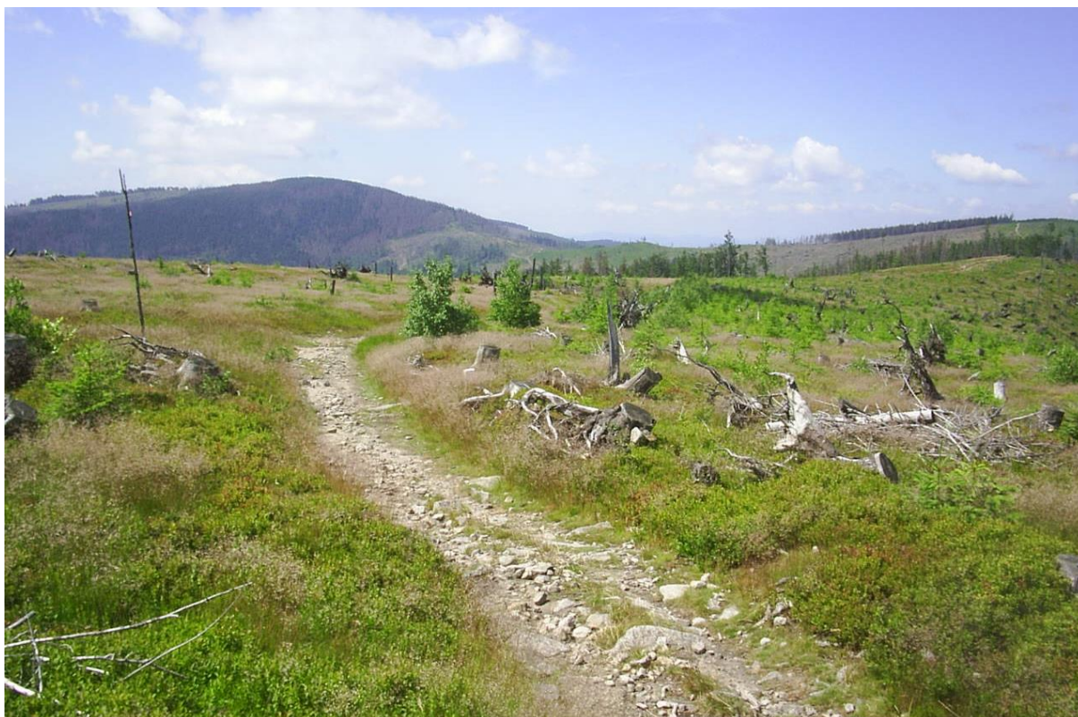
Fot. 81. Beskidzki poziom zrównania tworzący wypłaszczenie w grzbiecie Magurki Radziechowskiej

Wieloletowy rozwój rzeźby Beskidów pozostawił po sobie fragmenty powierzchni zrównań w postaci ciągu spłaszczeń grzbietowych i stokowych, na których często lokalizowano hale. Znaczenie dla prowadzenia gospodarki pasterskiej miały także wypłaszczenia osuwiskowe obfitujące w żyzne gleby i wody. Z czasem, gdy od poł. XVIII w. nasiliło się zjawisko „głodu ziemi” niewielkie nachylenie stoków w obrębie osuwisk umożliwiało także prowadzenie prac polowych.