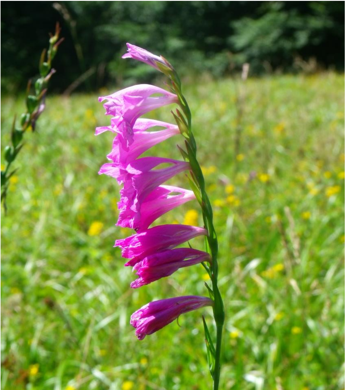
Fot. 72. Mieczyk dachówkowaty

Znaczenie ludowe: Polska nazwa „mieczyk” jest dosłownym tłumaczeniem nazwy łacińskiej Gladiolus i stanowi zdrobniąłą formę słowa gladius , oznaczającego krótki miecz rzymski, od którego pochodzi nazwa gladiator.