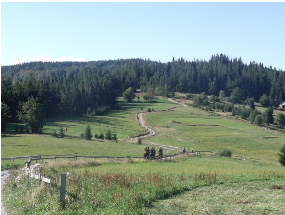
Fot. 27. Hala Boracza

Kompleks hal zlokalizowanych na grzbiecie odbiegającym z Redykałnego Wierchu i rozgałęziającym się w kierunku Prusowa oraz Suchej Góry.