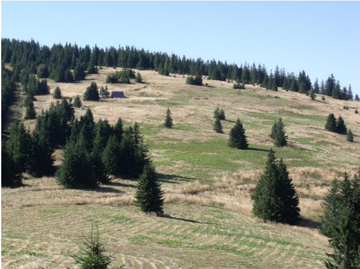
Fot. 26. Hala Cudzichowa

stronie – część ta nazywana Kruszetnicką Polaną jest współcześnie zalesiona. Nazwa hali pochodzi od nazwiska Cudzik, notowanego w XVIII wiecznym inwentarzu dóbr żywieckich. Prawdopodobnie był to jeden z właścicieli, stąd też można spotkać się z nazwą Cudzikowa. Nazwę podaje już „Dziejopis Żywiecki” Komonieckiego. Dawniej funkcjonowała również nazwa Hala Martoszowa. Obszar hali należy do Sopotni Wielkiej i według źródeł z 1930 r. stanowił własność 23 współników.