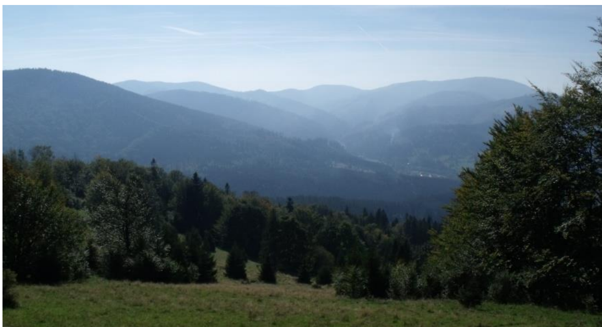
Fot. 43. Widok z Hali Praszywka

Praszywka Wielka – nazwa szczytu i rozległej zarastającej hali z licznymi ruinami dawnej zabudowy szałasowej, a także budynków mieszkalnych. Na polanie także ślady dawnej uprawy roli w postaci licznych kamiennych kopców zwanych krudami i śladami dawnych miedz. Przez polanę przebiega czarny szlak turystyczny z Rycerki Dolnej. Z Praszywki roztacza się widok na okoliczne szczyty Worka Raczańskiego.