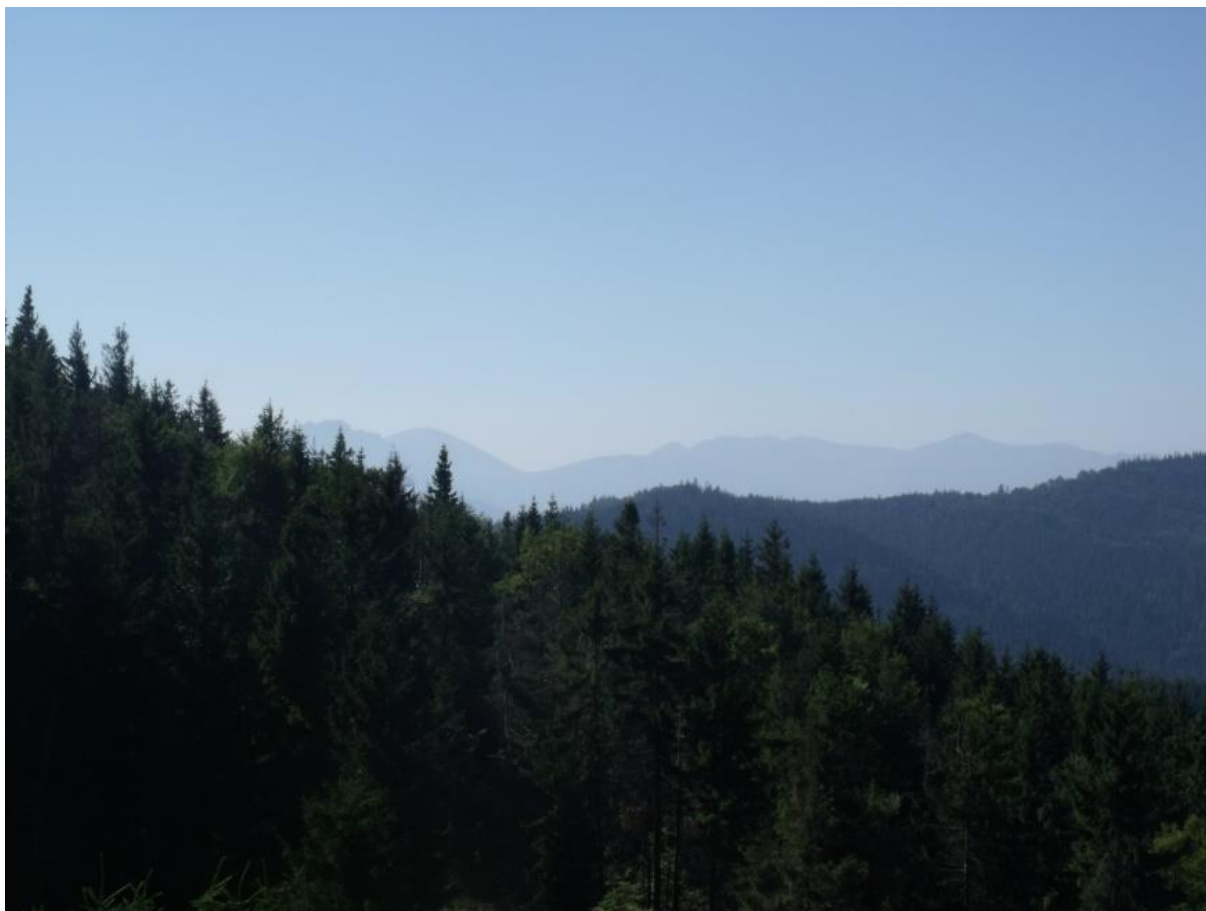
Fot. 22. Widok z Hali Bendoszki na Małą Fatrę

położonym w środkowej części „Worka Raczańskiego”, w biegnącym ku północy bocznym ramieniu odchodzącym od grzbietu granicznego w rejonie Bani, a kończącym się nad Rycerką Górną u zbiegu potoków Rycerka i Rycerki. Nazwa szczytu pochodzi od nazwiska Bendys. Halę porasta cenna przyrodniczo łąka mieczykowo-mietlicowa Gladiolo-Agrostietum , znajduje się tu stanowisko dzwonka piłkowanego Campanula serrata .