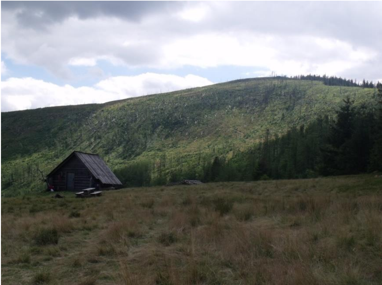
Fot. 2. Bacówka na Hali Baraniej

kozłkowo-turzycowa) Valeriano-Caricetum flavae i kwaśnej młaki górskiej Carici canescentis-Agrostietum caninae z udziałem kukułki szerokolistnej. Hala w dużym stopniu porośnięta jest zbiorowiskiem borówki czarnej Vaccinium myrtillus . Ponadto miejscami występują zespół maliny właściwej Rubetum idaei i zespół sitowia leśnego Scirpetum sylvatici , a na polanę wkracza świerk pospolity Picea abies . Z gatunków roślin chronionych występują tojad mocny Aconitum firmum i goryczka trojęściowa Gentiana asclepiadea .