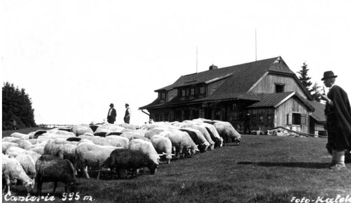
Fot. 8. Czantoria Wielka w okresie międzywojennym – wypas owiec

Przez polany przebiega czarny szlak turystyczny z Golezowa na Wielką Czantorię oraz żółty i niebieski z Ustronia.