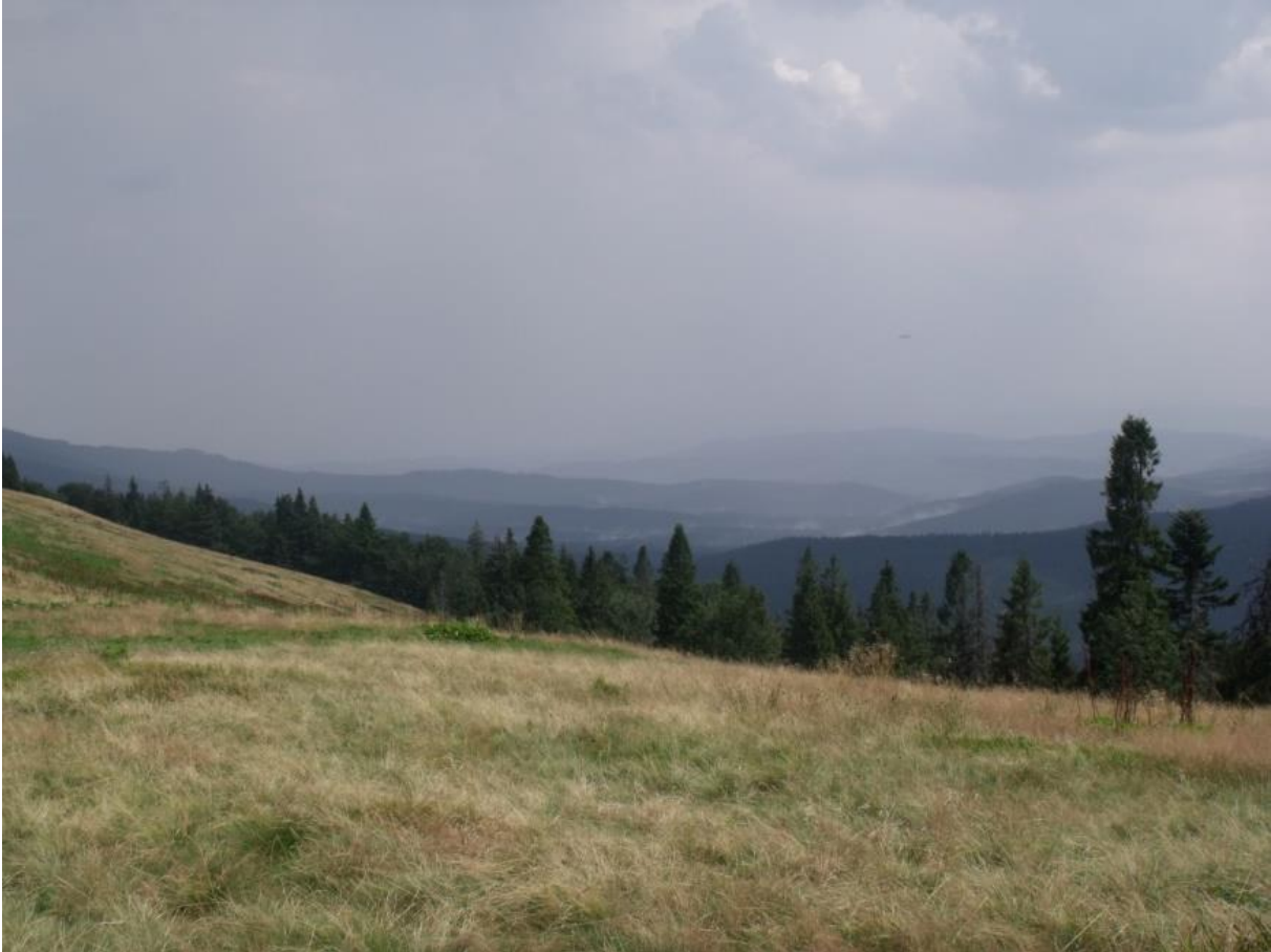
Fot. 21. Hala Bacmańska

Halę porasta cenna zachodniokarpacka murawa bliźniczkowa Hieracio (vulgati)-Nardetum . Duże powierzchnie zajmują płaty szczawiu alpejskiego Rumicetum alpini i zbiorowisko borówki czarnej Vaccinium myrtillus . Niewielkie powierzchnie zajmuje zbiorowisko z kłosówką miękką Holcus mollis , maliną właściwą Rubus idaeus i jeżyną fałdowaną Rubus plicatus . Hale porastają grupy świerka pospolitego Picea abies . Z gatunków chronionych spotkać można szafrana spiskiego (krokusa) Crocus scepusiensi , śnieżyczkę przebiśnieg Galanthus nivalis i dziewięciśia bezłodygowego Carlina acaulis .