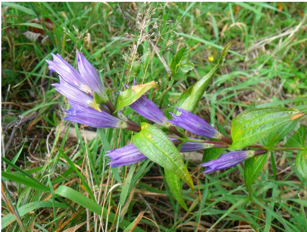
Fot. 68. Goryczka trojeściowa

Występowanie: góry środkowej i południowej Europy oraz Kaukaz, rzadka w Sudetach, częsta zaś we wszystkich pasmach Karpat