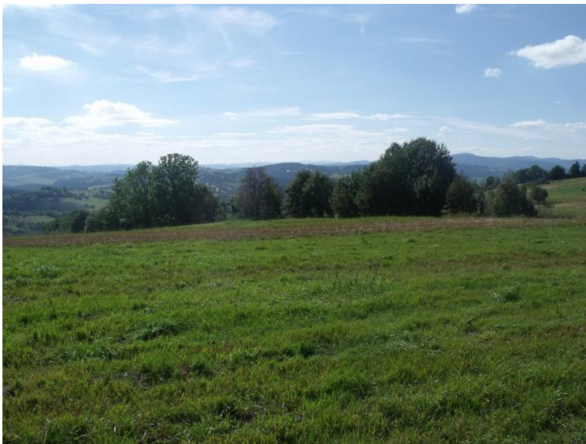
Fot. 18. Tyniok

Polana położona pod szczytem wierzchołka o tej samej nazwie (892 m n.p.m.) w Koniakowie. Nazwa pochodzi od „tyniny”, czyli listew „szczypanych” siekierą z świerkowego kłosa, z których wyplatano płoty do koszarowania owiec.