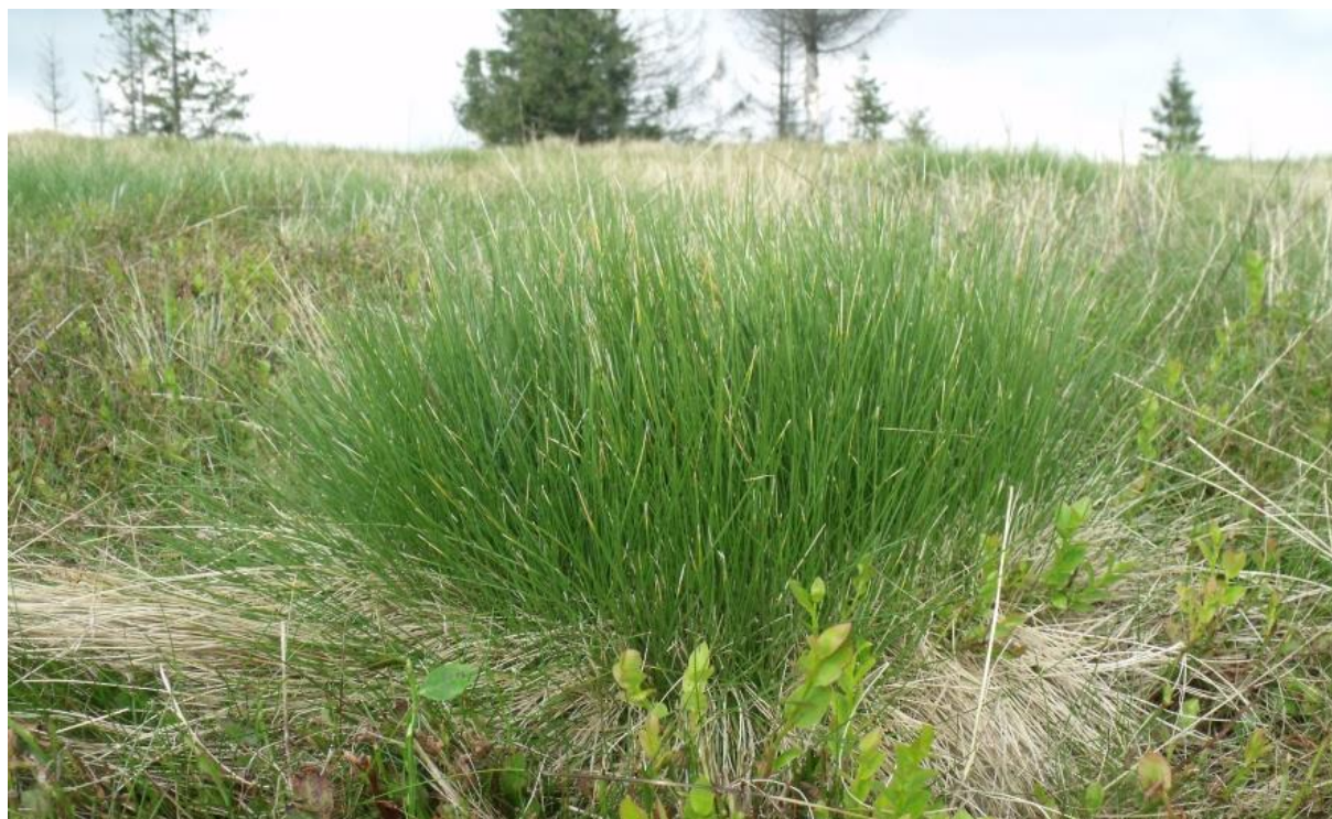
Fot. 54. Bliźniczka psia trawka na Hali Radziechowskiej

Zachodniokarpacką murawę bliźniczkową zalicza się do zbiorowisk półnaturalnych, które zajmują tereny po wyciętych lasach. Murawy bliźniczkowe w Polsce powstały w wyniku ich długotrwałego, ekstensywnego wypasu, przy słabym nawożeniu lub jego braku. W górach tworzą one rozległe obszarowo, jednorodne płaty, czasami występujące w mozaice z kosodrzewiną lub grupami świerków. Są one bardzo rozpowszechnione, ich różnej wielkości płaty można spotkać na niemal wszystkich górskich polanach. Największe obszary zajmują w reglu górnym i dolnej części pietra kosodrzewiny. W niższych położeniach zwykle zajmują bardzo niewielkie powierzchnie na wilgotnych brzegach oczek i torfowisk śródpolnych. Murawy bliźniczkowe rozwijają się na glebach umiarkowanie wilgotnych, kwaśnych, dystroficznych. Na nieużytkowanych polanach łatwo ulegają zarastaniu przez borówkę czarną oraz kosówkę i świerka.