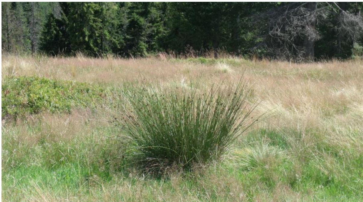
Fot. 57. Sit rozpięzchły

Zespół sitowia leśnego jest rozpowszechniony w całej Polsce. Po raz pierwszy został stwierdzony i opisany przez Edwarda Ralskiego w masywie Babiej Góry w 1931 r. W Beskidzie Śląskim i Żywieckim zespół ten wykształcił się w lokalnych zagłębieniach, na odlesionych źródłiskach w kompleksie łąk oraz na polanach śródleśnych. Zajmuje siedliska silnie uwilgotnione, często trwale zabagnione i zlokalizowane najczęściej w dolnych partiach stoków o słabym nachyleniu.