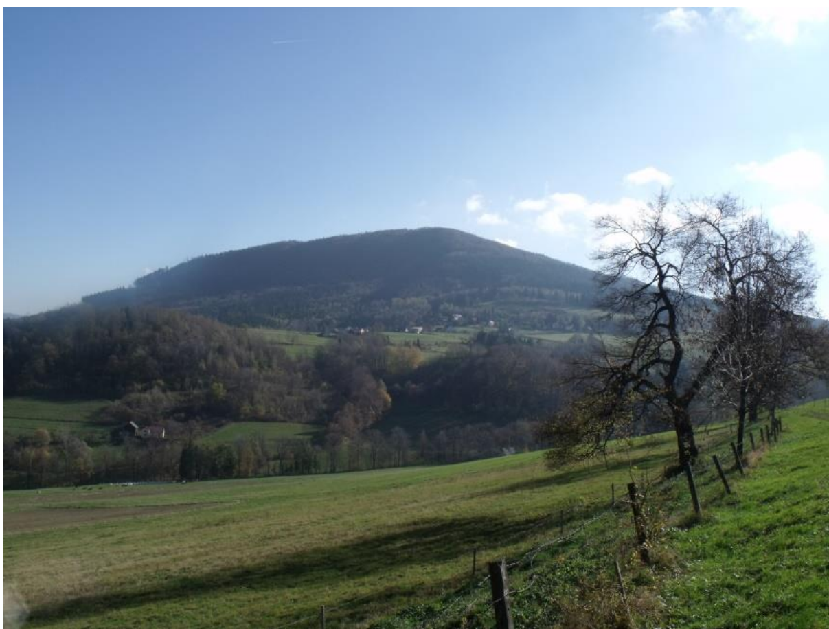
Fot. 17. Widok z Tułu w kierunku Małej Czantorii

cytowanie nazwy góry w pracach botaników XIX wieku oraz utworzenie tu w 1936 r. rezerwatu przyrody. Rezerwat ten obejmował przeszło 17 ha łąk i lasów. Jednak już od okresu międzywojennego postępowało niszczenie góry. Najpierw na skutek eksploatacji surowca przez cementownię w Golezowie, następnie w czasie II wojny światowej Niemcy urządzili tu stanowisko artylerii przeciwlotniczej wraz z odpowiednimi ziemiankami dla załogi i składów amunicji. Wycięto wówczas sporo drzew, uległa również zniszczeniu najbogatsza w storczyki łąka podszczytowa, którą zaorano i obsiano owsem w 1944 i 1945 r. W 1948 r. ponownie utworzono rezerwat w celu ochrony naturalnych stanowisk storczykowatych Orchidaceae oraz jedyne na Śląsku stanowiska dyptamu jesionolistnego Dictamnus albus .