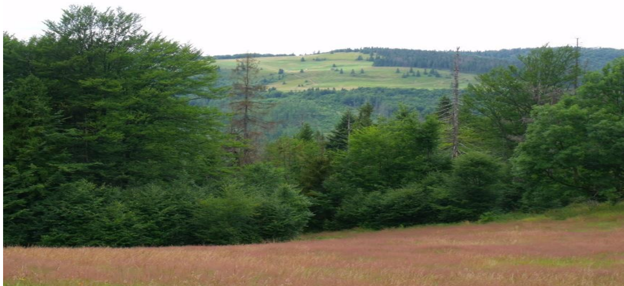
Fot. 51. Widok z Hali Śrubita na Halę na Raczy