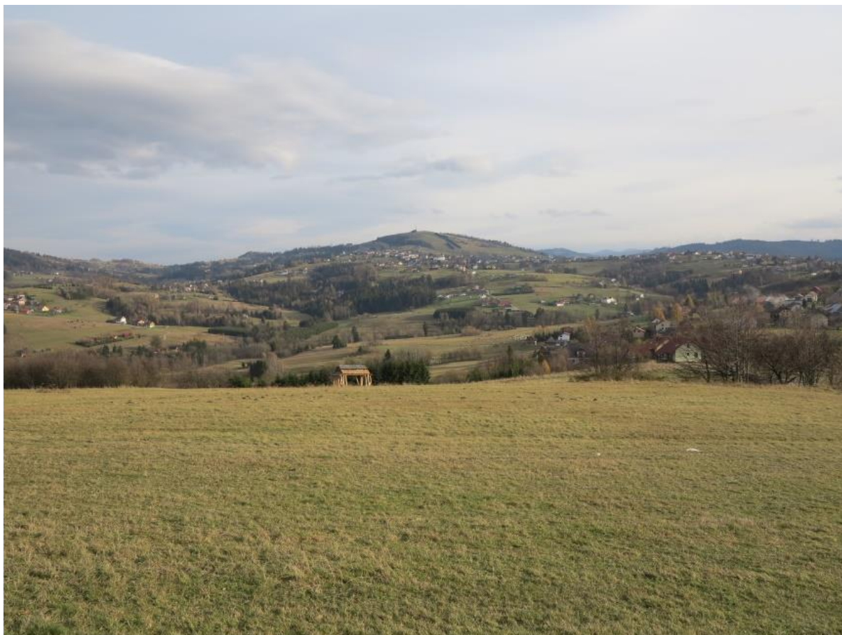
Fot. 19. Złoty Groń

Na północnych stokach znajdują się 3 wyciągi narciarskie, wyprowadzające z doliny Olzy na sam grzbiet góry. Na szczyt Złotego Gronia można dostać się za pomocą 6-osobowego wyciągu krzeselkowego wybudowanego w 2012 roku. W sezonie zimowym działa tu Ośrodek Narciarski Złoty Groń w Istebnej.