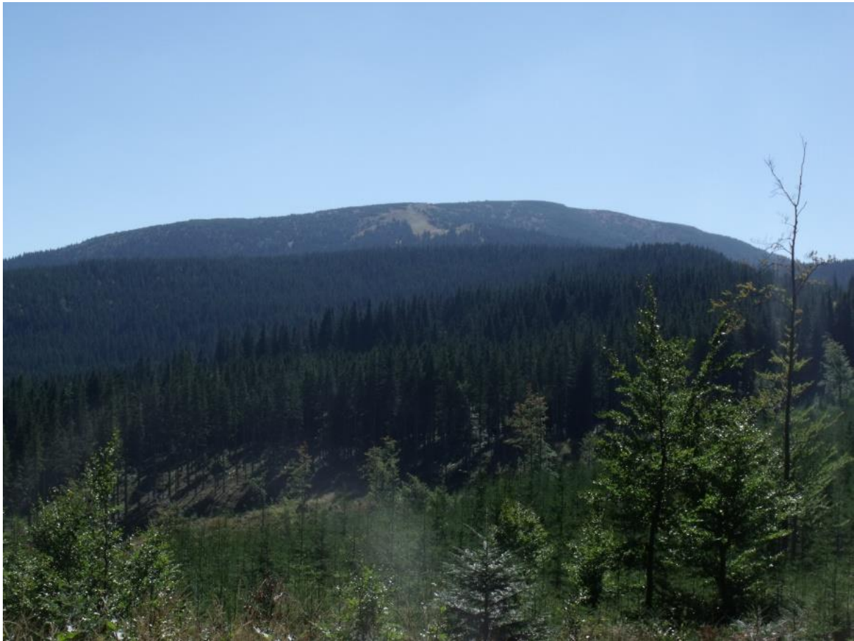
Fot. 80. Masyw Pilska

Z kolei rozległe obszary rolnicze niższych partii gór, z ekstensywnie użytkowaną mozaiką łąk, pastwisk, gruntów ornych i nieużytków, są także znakomitym miejscem do życia dla derkacza Crex crex , na którego ochronę kładzie się w Unii Europejskiej duży nacisk. Polska jest jednym z krajów o najliczniejszej populacji tego gatunku, a góry stanowią ważną jego ostoję. W Polsce derkacz w okresie lęgowym zasiedla dość szerokie spektrum otwartych i półotwartych siedlisk. Preferuje nieużytki, turzycowiska, ziołorośla oraz ekstensywnie użytkowane łąki i pastwiska. Istotnym elementem siedlisk lęgowych derkacza, szczególnie na obszarach wykorzystywanych rolniczo, jest obecność nieużytkowanych od co najmniej poprzedniego roku nieskoszonych fragmentów łąk, obrzeży rowów melioracyjnych porośniętych ziołoroślami, zakrzewień i pojedynczych krzewów.