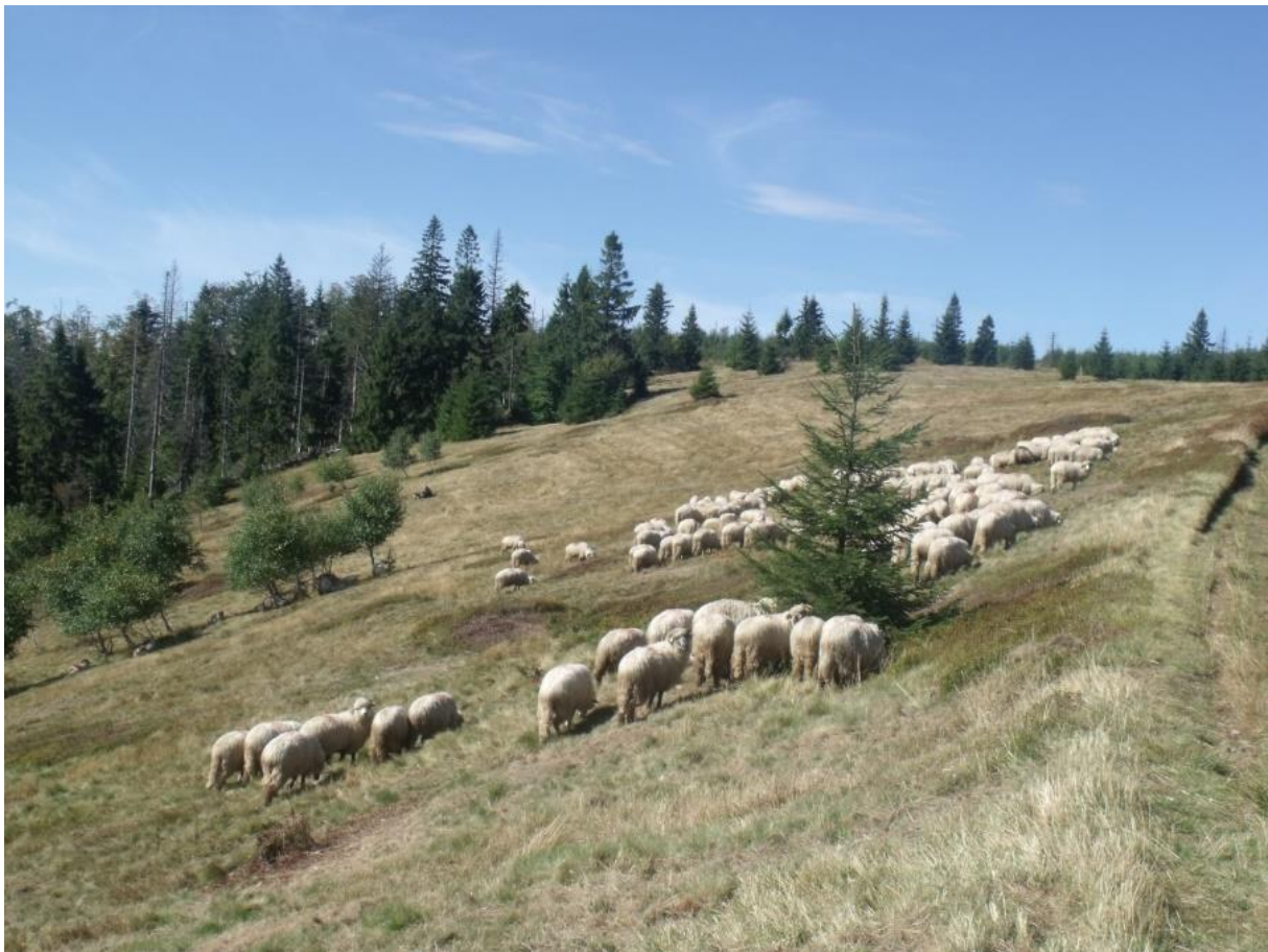
Fot. 53. Wypas owiec w ramach programu Owca Plus na Hali Radziechowskiej

Z kolei w piętrze górnym proces zarastania rozpoczął się już w połowie XIX wieku na skutek upadku szałaśnictwa, a przybrał on na sile zwłaszcza po 1989 r., kiedy w wielu miejscach całkowicie zarzucono wypas owiec. Współcześnie zarastanie hal zostało w wielu przypadkach zahamowane na skutek realizacji różnych działań związanych z ochroną przyrody beskidzkich hal, np. w ramach Wojewódzkiego Programu Aktywizacji Gospodarczej oraz Zachowania Dziedzictwa Kulturowego Beskidów i Jury Krakowsko-Częstochowskiej „Owca Plus” czy projektu Life+ „Ochrona zbiorowisk nieleśnych na terenie Beskidzkich Parków Krajobrazowych”.