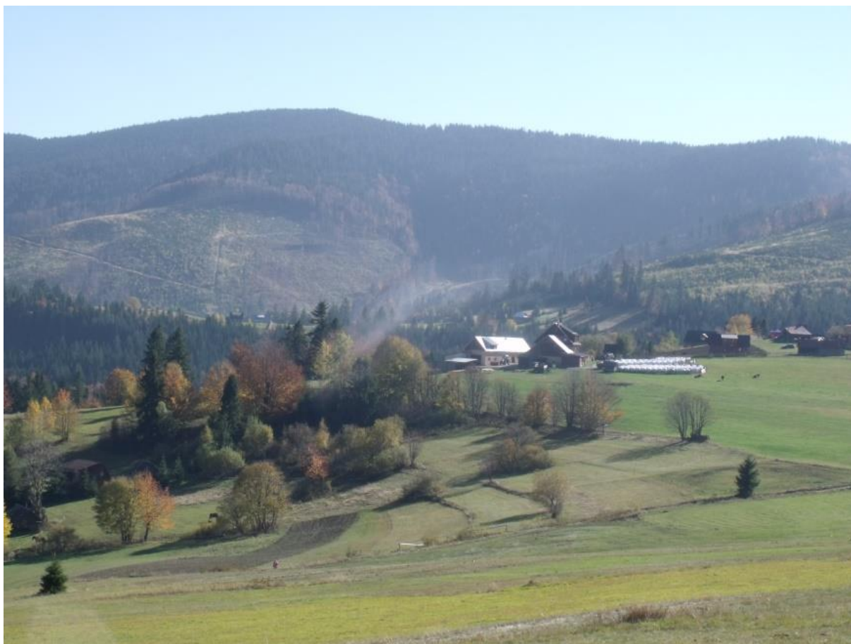
Fot. 28. Zabudowania przysiółka Milówki na Hali Boraczej

Hala Boracza w dużym stopniu zajęta jest przez zabudowania przysiółka o nazwie Milówki, w przeszłości domostwom towarzyszyły liczne pola uprawne. Uprawiano tu głównie owies i ziemniaki. Pozostałością po nich są liczne kopce zbieranych z pól kamieni, które składowano z reguły pod jarzębinami. Ponadto w obrębie całego kompleksu hal spotkać można tereny użytkowane jako łąki i pastwiska. Hale porastają zbiorowisko mietlicy pospolitej i kostrzewy czerwonej Agrostis capillaris-Festuca rubra , łąka z rzędu górskich łąk konietlicowych użytkowanych ekstensywnie Polygono-Trisetion , czy cenna przyrodniczo zachodniokarpacka murawa bliźniczkowa Hieracio (vulgati)-Nardetum . Uroku hali dodają grupy drzew zlokalizowane wzdłuż miedz: grupy świerka pospolitego Picea Abies i buka zwyczajnego Fagus sylvatica . Ponadto w niektórych miejscach spotkać można zbiorowisko maliny właściwej Rubus idaeus , jeżyny fałdowanej Rubus plicatus , borówki czarnej Vaccinium myrtillus , zarośla wierzby Salix sp. , zbiorowisko situ skupionego Juncus conglomeratus i bardzo cenną kwaśną młakę górską Carici canescentis-Agrostietum caninae . Z gatunków chronionych występuje dziewięciśń bezłodygowy Carlina acaulis .