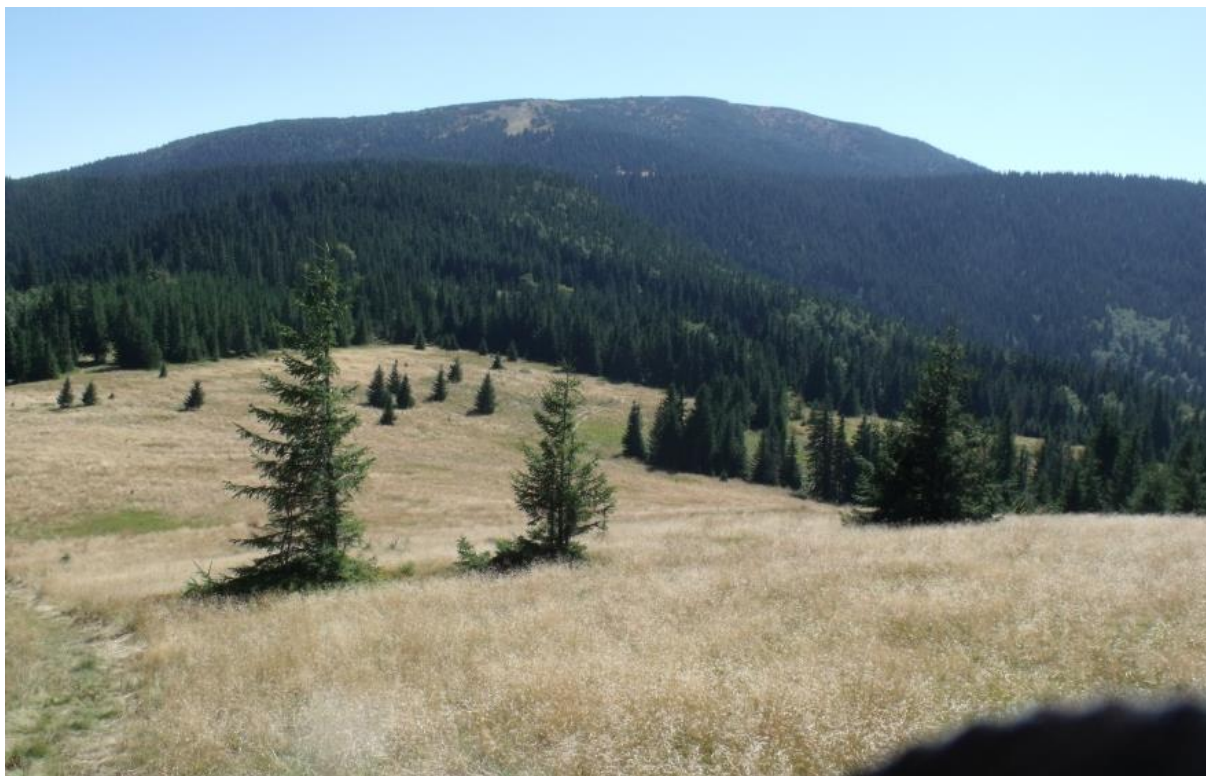
Fot. 34. Hala Jodłowcowa z widokiem na Pilsko

Na hali można zobaczyć cenną przyrodniczo zachodniokarpacką murawę bliźniczkową Hieracio (vulgati)-Nardetum i łąkę mieczykowo-mietlicową z dużym udziałem śmiałka darniowego Gladiolo-Agrostietum deschampsietosum . Z cennych zbiorowisk na uwagę zasługuje także żyzna młaka górską (młaka kozłkowo-turzycowa) Valeriano-Caricetum flavae . Ponadto halę miejscami porastają zbiorowisko z kosmatką olbrzymią Luzula sylvatica , zespół maliny właściwej Rubetum idaei , zbiorowisko borówki czarnej Vaccinium myrtillus i grupy świerka pospolitego Picea abies . W kilku miejscach można też zobaczyć kępy szczawiu alpejskiego Rumex alpinus i grupy jałowca pospolitego Juniperus communis . Z gatunków chronionych występują czosnek syberyjski Allium sibiricum , pełnik alpejski Trollius altissimus , tojad mocny Aconitum firmum i dziewięciśń bezłodygowy Carlina acaulis .