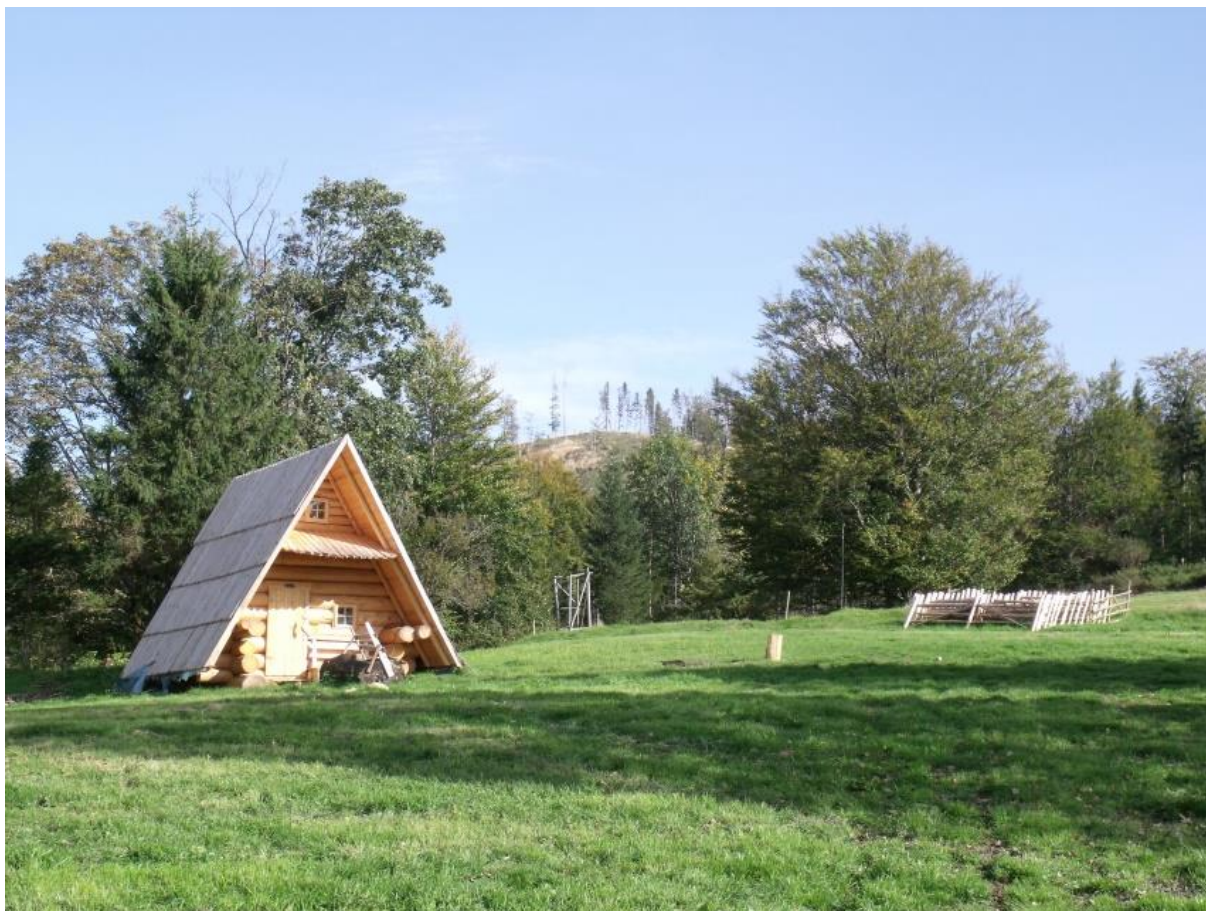
Fot. 45. Nowa bacówka na Przysłopie Potóckim

Przysłop Potócki – nazwa głębokiej przełęczy (870 m n.p.m.) pomiędzy Bendszką Wielką a Praszywką Wielką, pokrytej malowniczymi łąkami. Nazwa pochodzenia wołoskiego, często spotykana w Karpatach na określenie bezleśnych przełęczy. Na polanie spotkać można jeszcze ruiny dawnych szałasów pasterskich. Uroku polanie dodają okazałe samotne drzewa. Część zabudowy szałasowej wykorzystywana jest przez studencką bazę namiotową. Obok bazy zlokalizowana jest nowa bacówka powstała w ramach programu Owca Plus. Przez przełęcz przebiega czarny szlak turystyczny z Rycerki Dolnej.