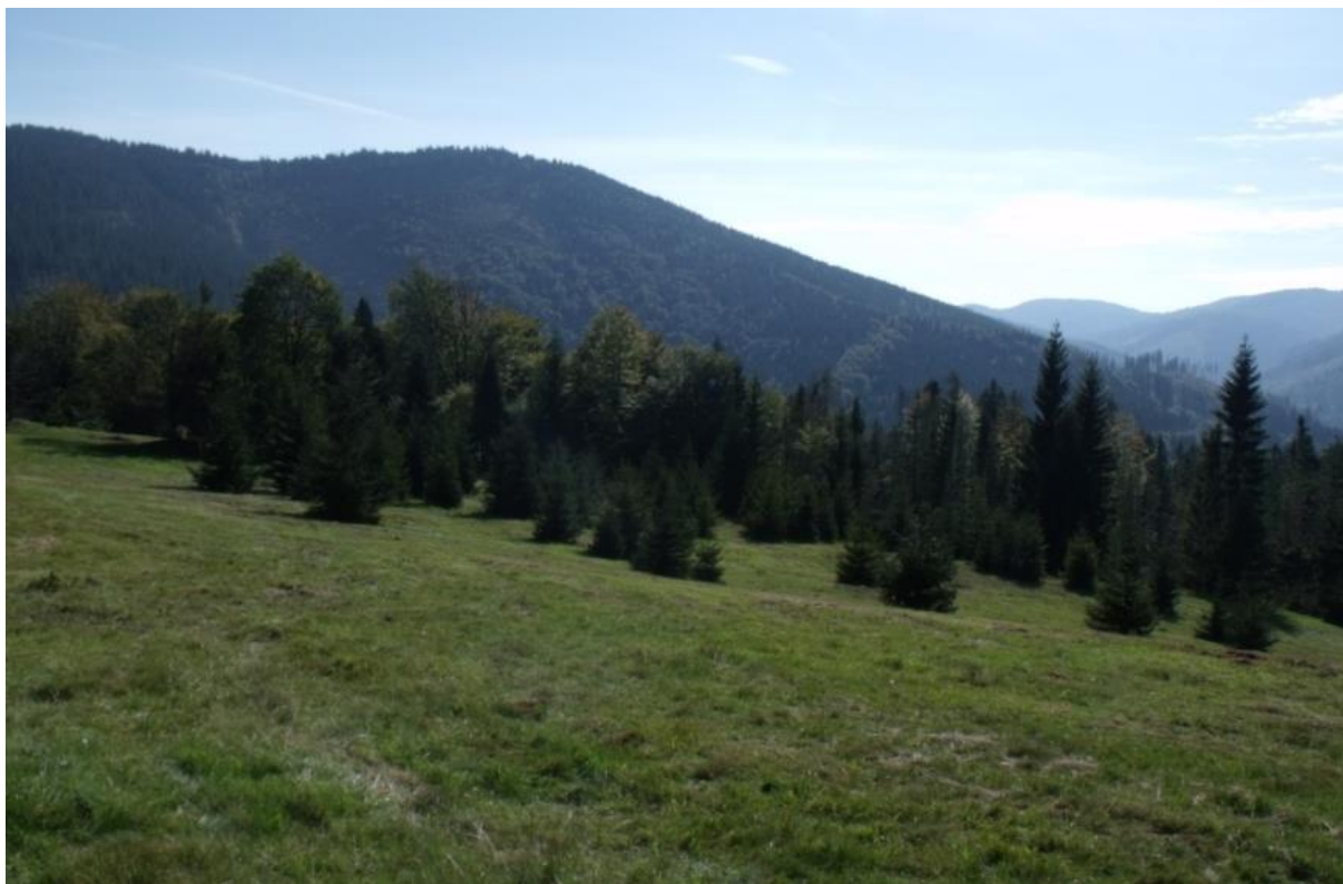
Fot. 46. Przysłop Potócki