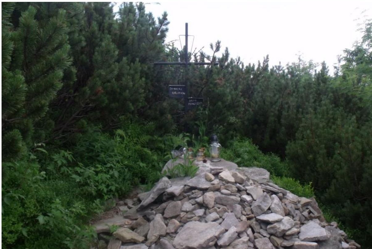
Fot. 1. Kosodrzewina na Pilsku

Ostatnim piętrzem na omawianym obszarze jest piętro kosodrzewiny (subalpejskie), które zajmuje całą szczytową część Pilska. Zarośla kosodrzewiny przeplatają się tu z płatami wysokogórskich zbiorowisk krzewinkowych z bażyną obupłciową Empetrum hermaphroditum i traworośli z trzcinnikiem owłosionym Calamagrotis villosa .