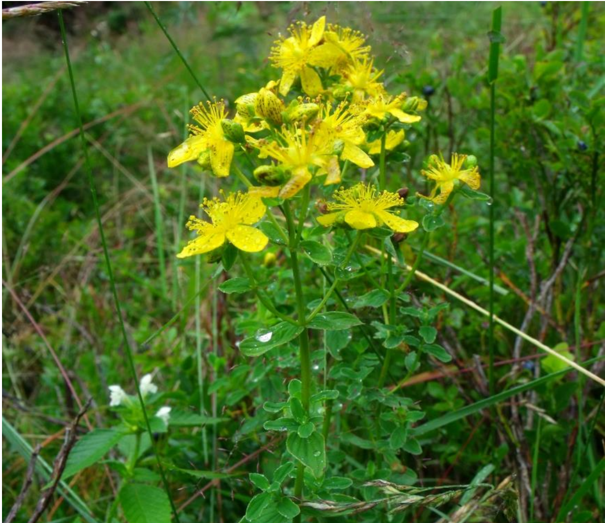
Fot. 59. Dziurawiec czteroboczny

naparstnica zwyczajna Digitalis grandiflora , mieczyk dachówkowaty Gladiolus imbricatus czy podkolan biały Platanthera bifolia .