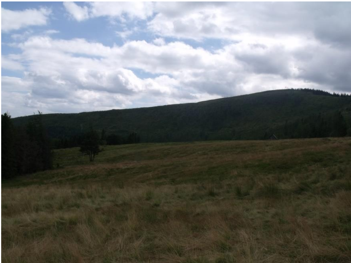
Fot. 55. Murawa bliźniczkowa na Hali Radziechowskiej

Występują one na siedliskach nieco przesuszonych, o małej zdolności retencyjnej, jałowych i silnie zakwaszonych, ubogich w składniki mineralne, co jest spowodowane ich łatwym wymywaniem. Najczęściej murawy bliźniczkowe w górach występują na stokach o ekspozycji południowej. Mogą pokrywać zarówno miejsca płaskie, jak i silnie nachylone stoki, nawet do 40-45°.