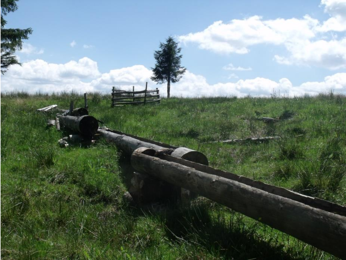
Fot. 84. Ujęcie źródła jako wodopój dla owiec.

zabrać owcom mleka. W tym samym celu przestrzegano zakazu mycia w potoku rąk i kadzi, w której robiono ser, aż do dnia św. Jana Chrzciciela.