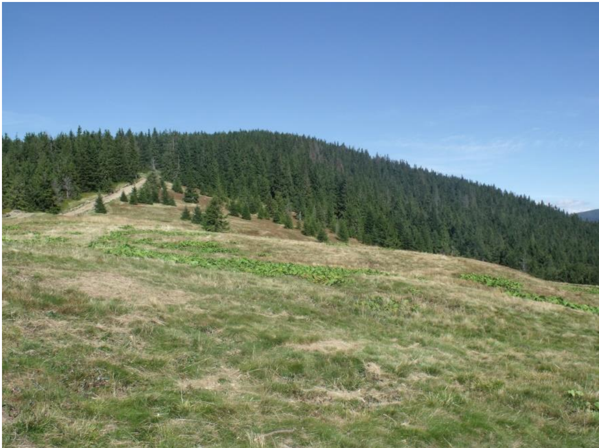
Fot. 23. Hala Bieguńska

Rozległa hala położona na południowych, podszczytowych stokach pomiędzy Boraczym Wierchem (1244 m n.p.m.) a Lipowskim Wierchem (1324 m m.p.m.). Jej nazwa pochodzi od właściciela o nazwisku Biegun. Hala Bieguńska znajduje się na wysokości około 1160–1225 m n.p.m. powyżej źródeł Zajaków Potoku i Śmierdzącego Potoku. Często jej dwóm częściom przypisuje się oddzielne nazwy: część zachodnia to Hala Gawłowska, część wschodnia to Hala Bieguńska.