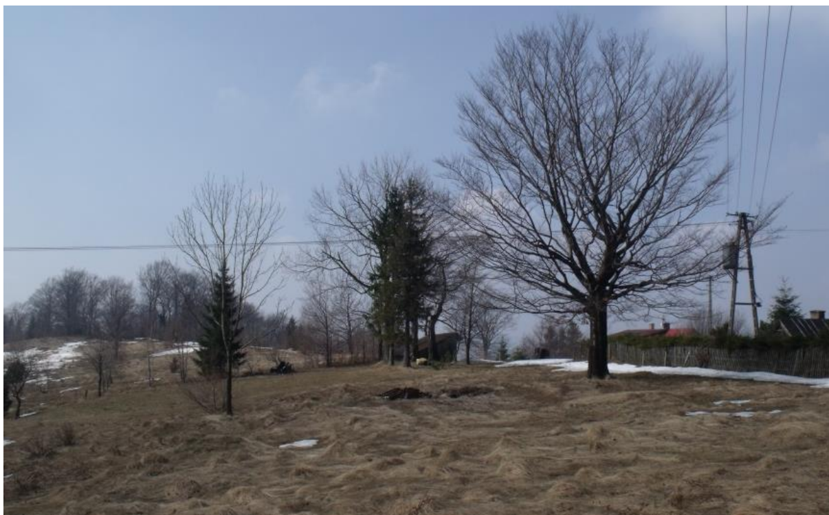
Fot. 13. Orłowa

deltoidis . W przeszłości był to jeden z największych ustronńskich szałasów. Przebiega tędy niebieski szlak z Równicy na Trzy Kopce Wiślańskie, a także kończą swój bieg – żółty z Brennej Leśnicy i zielony z Ustronia Polany.