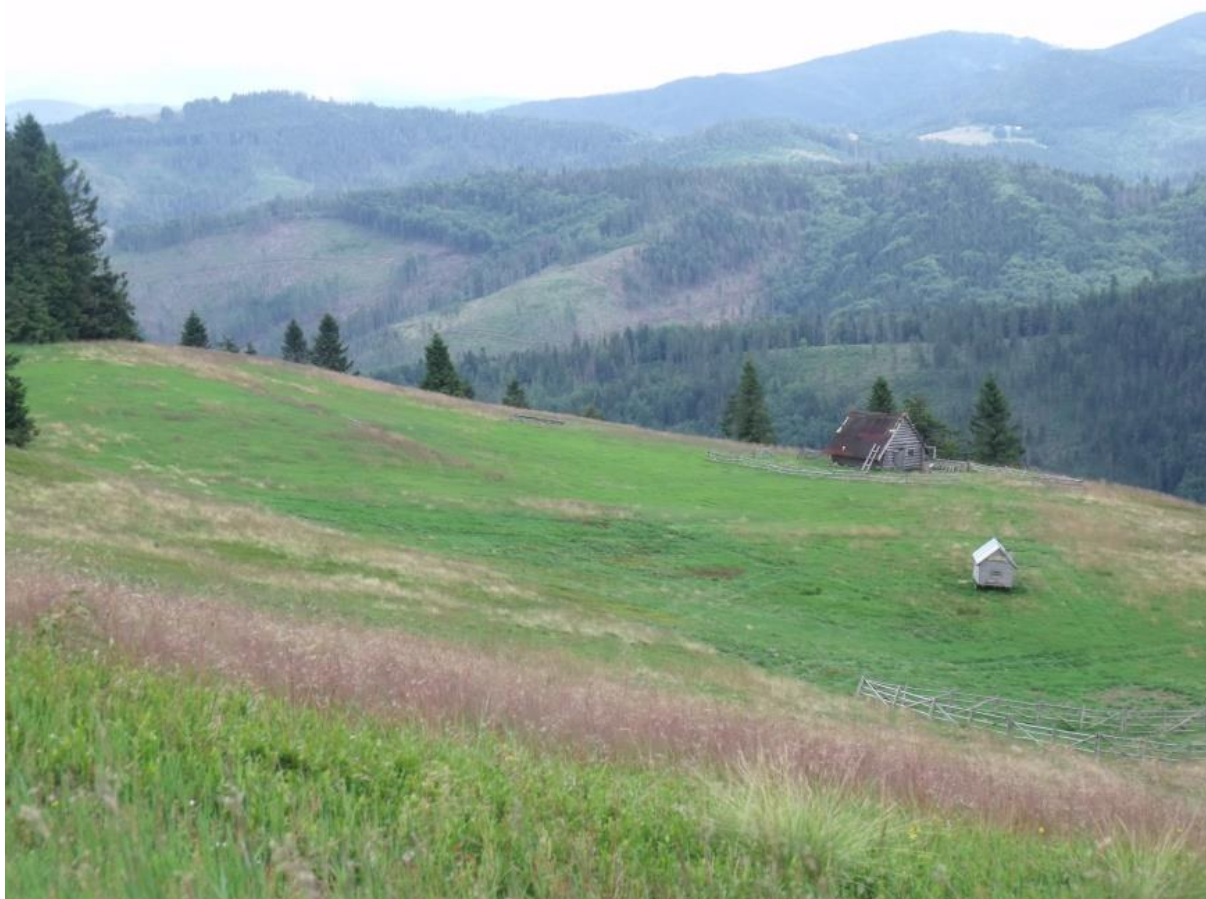
Fot. 38. Hala na Raczy

W połowie XVI wieku na hali wypasali swoje stada pierwsi wołoscy pasterze. Wkrótce potem między pasterzami z posiadłości ziemskich Budatina i Streczna (Budatinske a Strcnanške panstvo) dochodziło do krwawych walk o tereny pasterskie. W XVII i XIX wieku w lasach Wielkiej Raczy i w okolicach ukrywali się zbójnicy, na których urządzano obławy z udziałem miejscowej ludności okradanej przez zbójników.